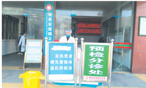
▲ 安居镇卫生院预检分诊