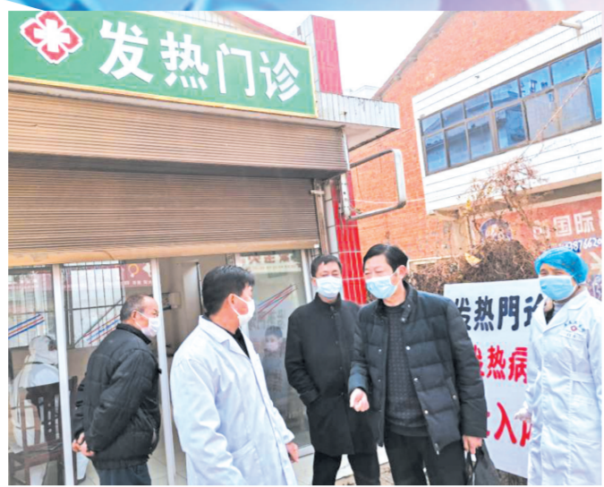
▲ 安居镇卫生院发热门诊