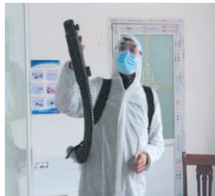
▲ 全方位消杀,不留死角