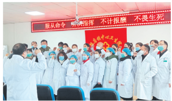
▲ 党员干部集体宣誓

一场突发的新冠肺炎疫情打破了春节的热闹与祥和。“疫情就是命令,防控就是责任”,为有效应对疫情,切实保障人民群众身体健康和生命安全,随县殷店镇卫生院全体干部职工主动放弃春节假期,舍小家保大家,全力以赴地投入到抗击疫情工作中去。