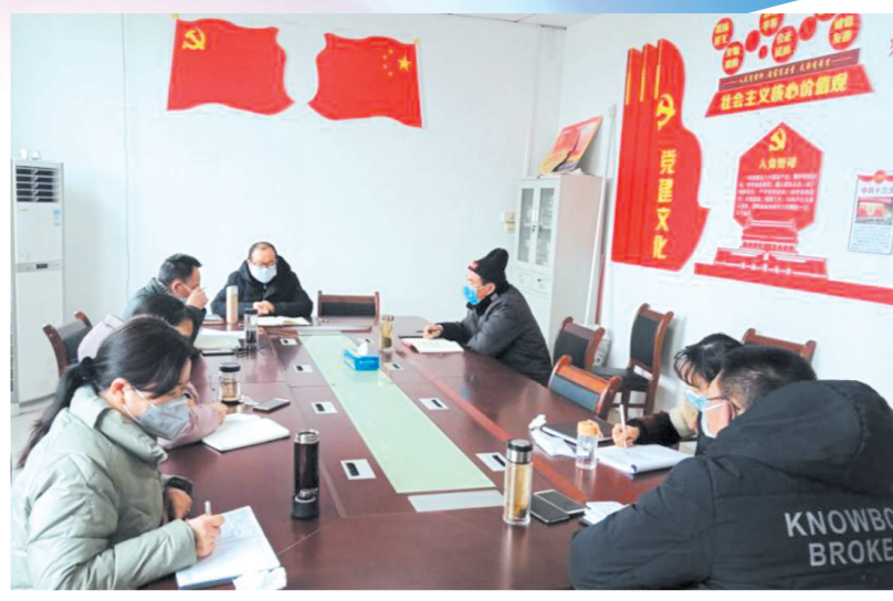
▲ 科学部署疫情防控