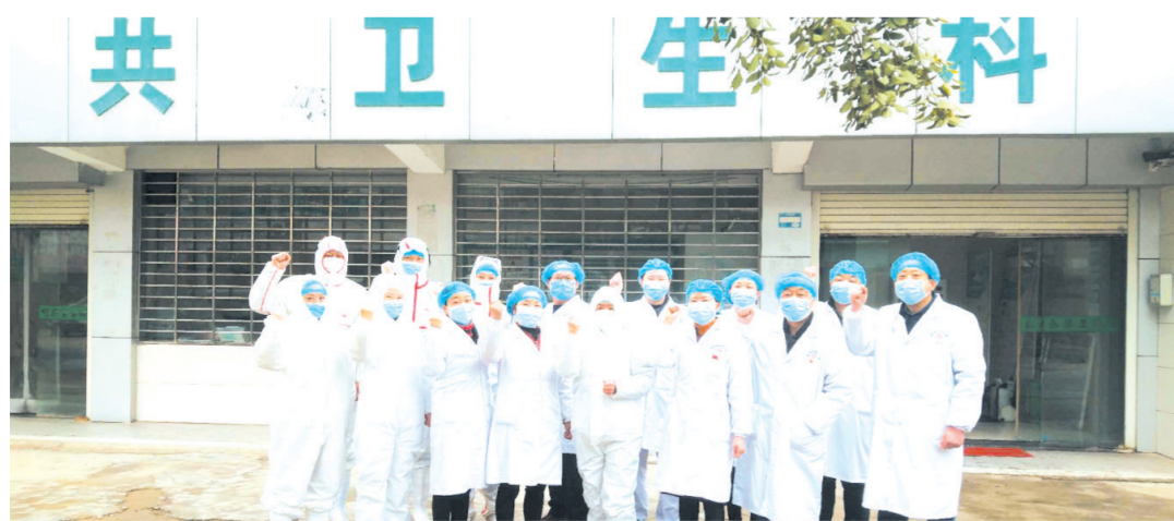
▲ 安居镇卫生院公共卫生科

疾风知劲草,危难见忠诚。在这次疫情期间,安居镇卫生院全体工作人员个个勇挑重担,齐心协力,共同做好了安居镇新型冠状病毒肺炎的防控救治收转工作,并实现全体医务人员“零感染”!安居镇卫生院向全镇人民交上了一份满意的答卷!