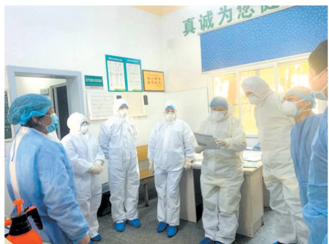
▲ 安居镇卫生院医护人员在隔离病房讨论