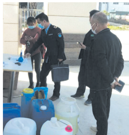
▲ 对复工复产企业进行疫情防控督导