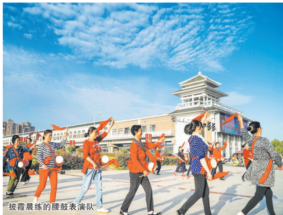
披霞晨练的腰鼓表演队

瑰霞映城,流光溢彩。天光云彩,如梦如幻。今年以来,璀璨绚烂的彩霞频频“造访”随州,天空好像一张画纸,让霞光这只奇妙的画笔在上面任意地挥洒。迷人的霞光瑰丽壮观,变幻莫测、色彩斑斓的云彩与府河碧水两相辉映,碧波荡漾,天水相依,如诗如画,令市民游人惊叹不已,沉醉其中。 专家介绍,朝霞和晚霞的形成都是由于空气对光线的散射作用。太阳在地平线升起或者落下时,光线与地面的夹角很小,阳光就要通过比一天中任何时候都要厚的大气层才能到达地面。这时候,太阳光谱中波长较短的紫、蓝、青等颜色的光在漫长的穿越大气的过程中被散射得所剩无几,只留下波长较长的红、橙、黄等颜色的透射能力强的光。这些光线经空气分子和水汽等散射后,将天空染上了绚丽的色彩,形成五彩缤纷的霞。霞的亮度和绚烂程度与空气质量有密切的关系。空气质量好,大气透水性也比较好,有利于色彩绚丽的霞光出现。如果空气质量差的话,人们就只能看到灰蒙蒙的霞光了。 近年来,市委、市政府始终把生态文明建设作为统筹推进“五位一体”总体布局和协调推进“四个全面”战略布局的重要内容,将打造生态绿城作为建设品质随州的重大战略部署,城市建设坚持生态优先、绿色发展,城市空气优良率大幅提升。随着基础设施的不断完善,城市生态和人居环境的改善,形成了一条生态和谐的“水净、岸绿、景美”的靓丽城市生态风景线,绚丽的“霞光秀”也就随之频频现身,与澄澈的“随州蓝”一起,在天空主演了一幕幕梦幻的“视觉大片”。