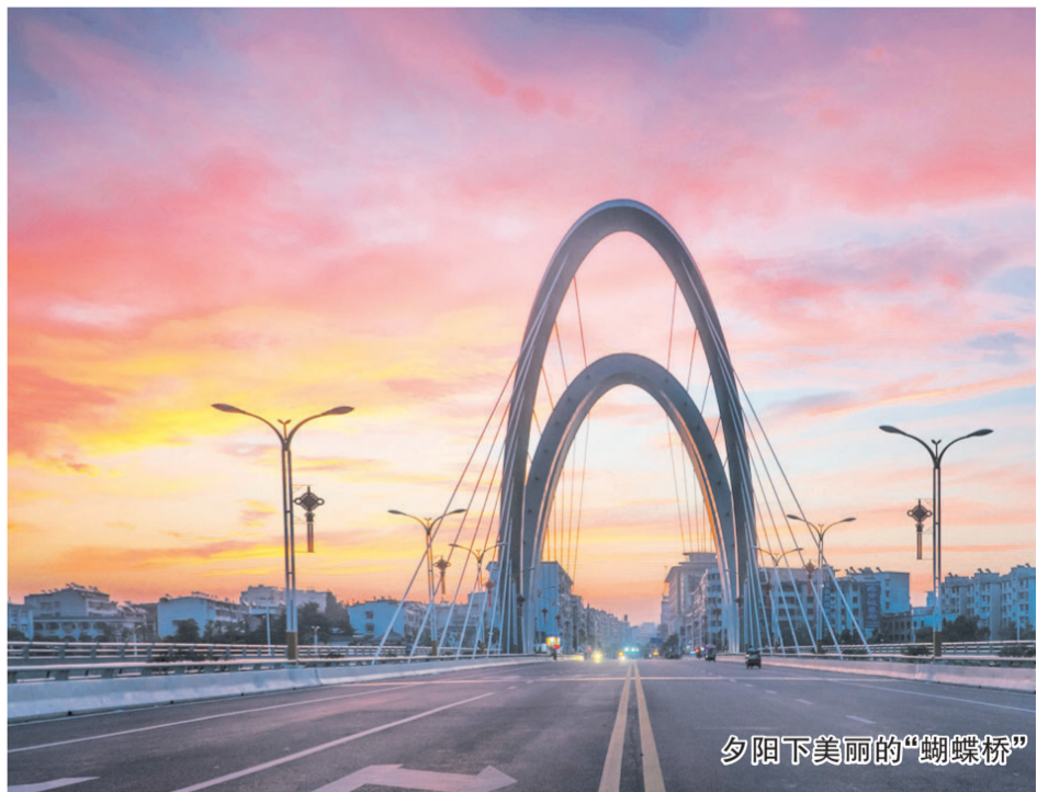
夕阳下美丽的“蝴蝶桥”