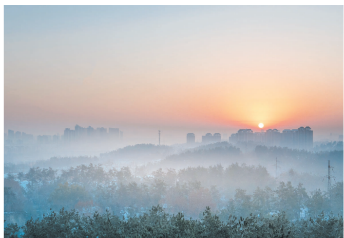
朝霞雾影宛若仙境