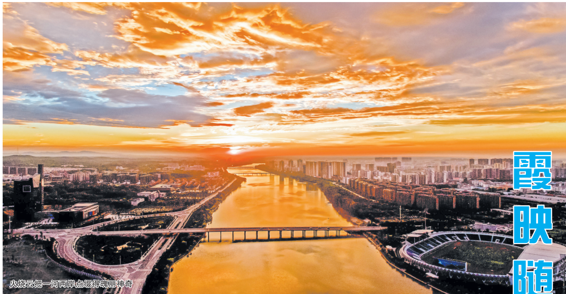
火烧云把一河两岸点缀得瑰丽神奇