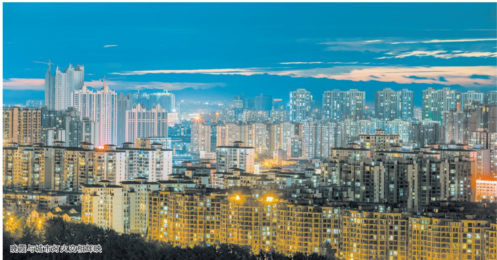
晚霞与城市灯火交相辉映