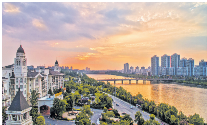
落日余辉下的府河熠熠生辉