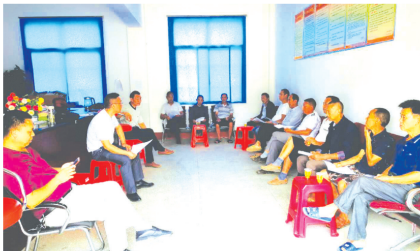
▲ 产权制度改革会议