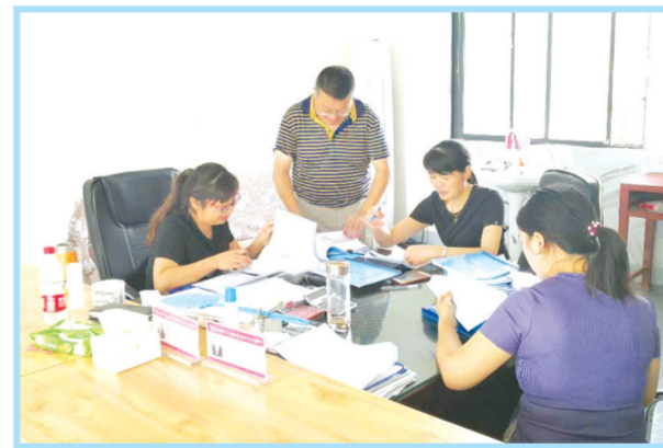
▲ 精准扶贫资金审计

展望未来,路漫漫其修远兮,三里岗财政所将继续发扬“滚石上山、抓铁留痕”的担当精神,以“人争优胜,事争一流”的拼搏精神,把三里岗镇财政所各项工作推向新阶段,为谱写随县财政的崭新篇章作出新贡献!