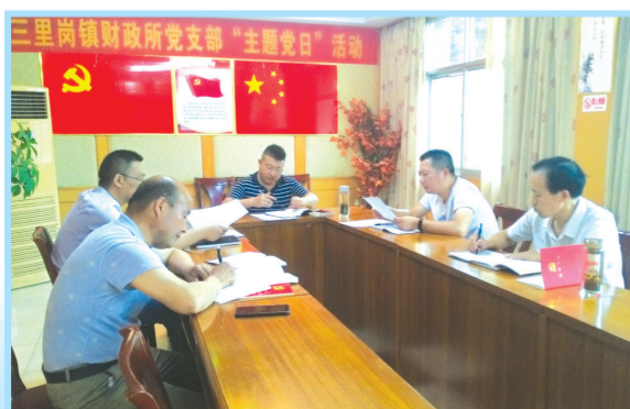
▲ 开展支部主题党日

通过此次学习教育活动,财政干部队伍精神焕发,积极投入到各项群众服务工作中去。财政所干部职工参加了镇吉祥寺村参加“洁美家园大行动”、镇政府组织的义务献血活动、为复退军人捐款等志愿服务活动。财政所支部积极筹措资金,招商引资,为驻点村栗树嘴村解决了3万元用于文化广场建设,为三组20户村民解决了用电难问题,为杨家棚村美丽乡村提档升级110万项目解决招标审计实际问题。