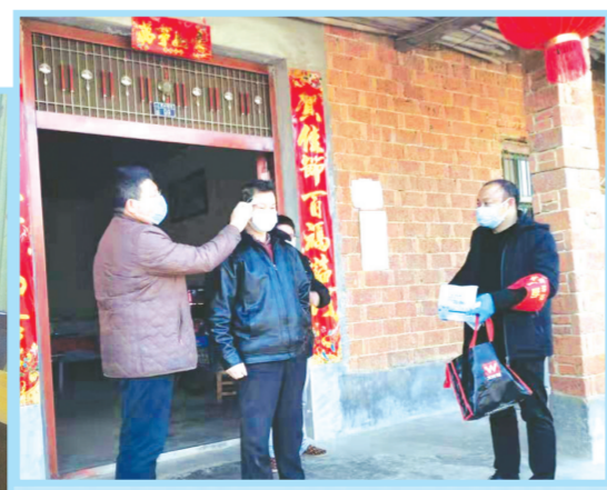
▲ 驻村新冠疫情防控