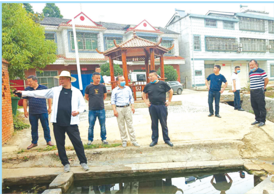
▲ 杨家棚村美丽乡村建设

近年来,随县三里岗镇财政所把抓好党建工作作为开展财政工作、加强队伍建设的基点和抓手,全面推进思想建设、组织建设、作风建设、制度建设和反腐倡廉建设,努力提高基层党建水平,激发大家的工作热情,树立部门形象,推动各项工作不断迈上新台阶。