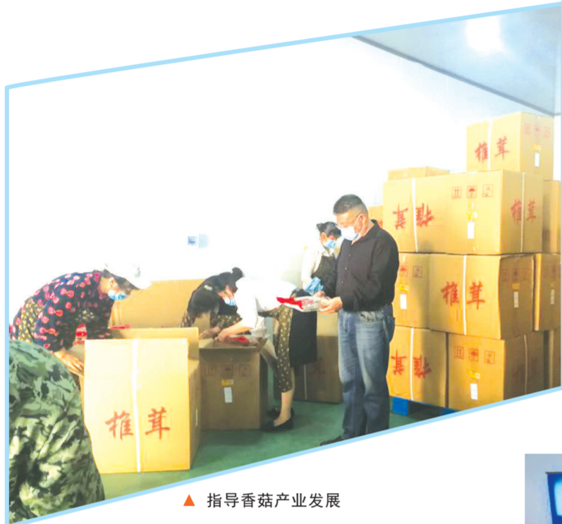
▲ 指导香菇产业发展