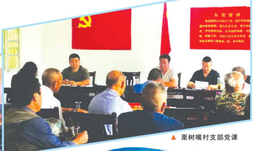
▲ 栗树嘴村支部党课