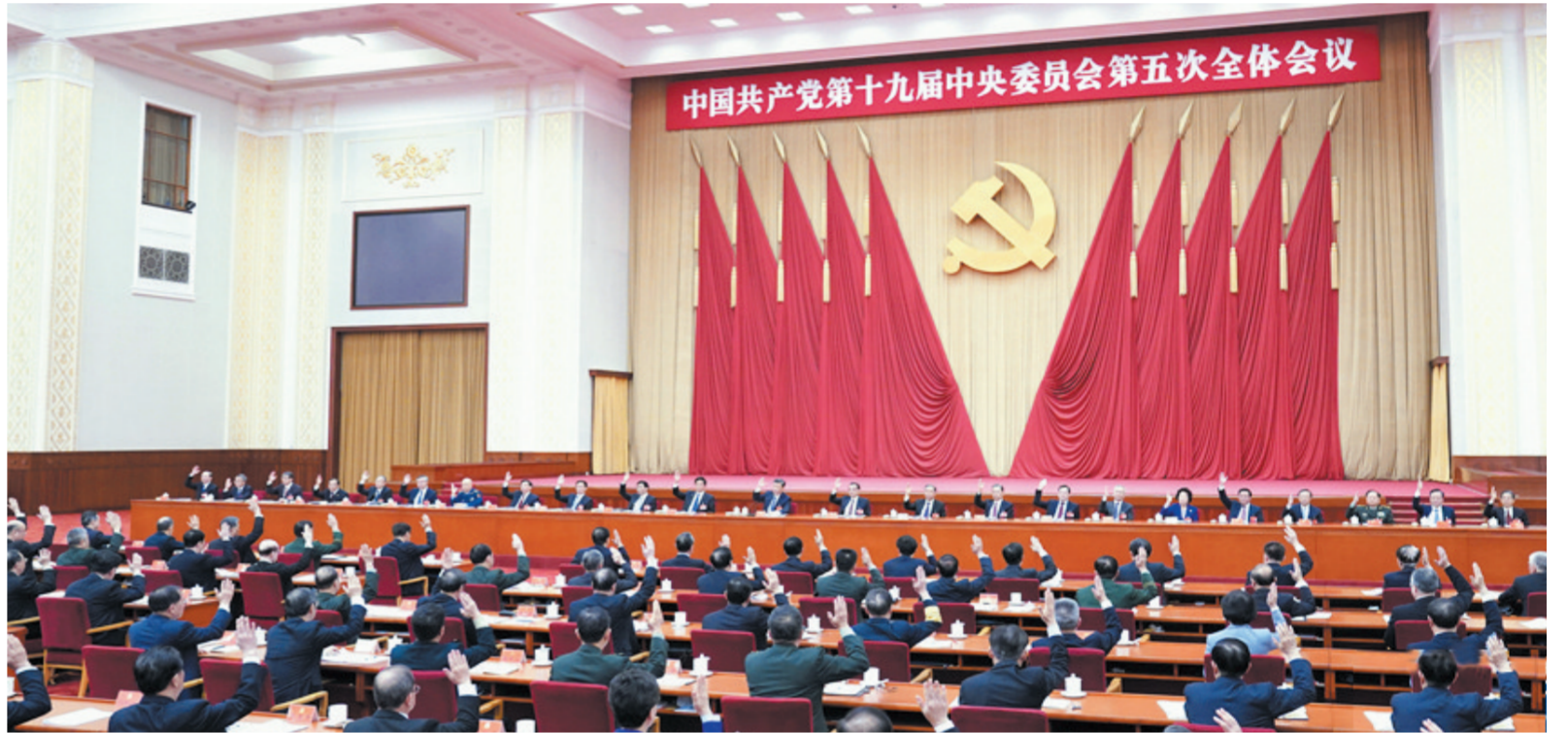
中国共产党第十九届中央委员会第五次全体会议，于2020年10月26日至29日在北京举行。中央委员会总书记习近平作重要讲话。