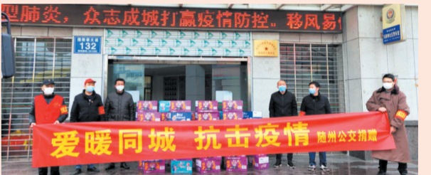
▲ 市公交公司向社区捐赠抗疫物资

展望未来,市公交公司全体干部员工将齐心协力、攻坚克难,用肩上的责任和心中的爱,筑起一道道坚固的公交线,为疫情防控和随州高质量发展作出随州公交应有的贡献。