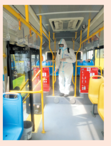
▲ 定时为公交车辆消毒、通风