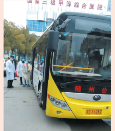
▲ 开通医护人员通勤专线