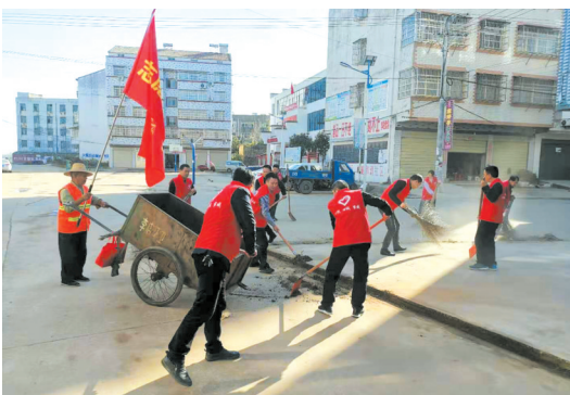
环卫工人忙碌地清扫卫生

塑风貌、抓典型、重常态、建机制、促长效。李店镇紧紧围绕乡村“脏、乱、差”现象,先后开展了“环境卫生百日攻坚”“镇村环境集中整治”“爱国卫生月”“镇村环境卫生整治行动”等整治活动。截至目前,全镇共投资160余万元,共出动人工8500余人次,动用机械220余台次,清理垃圾2万余方,栽植各类花卉树木65000余株,建设高规格绿化带3万余平方米,拆除破旧瓦房和残垣断壁3100平方米,粉刷沿路两侧管护房墙面4万平方米,粉刷新