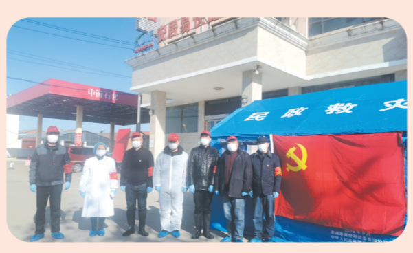
▲南郊街道隔离点党员志愿者坚守岗位