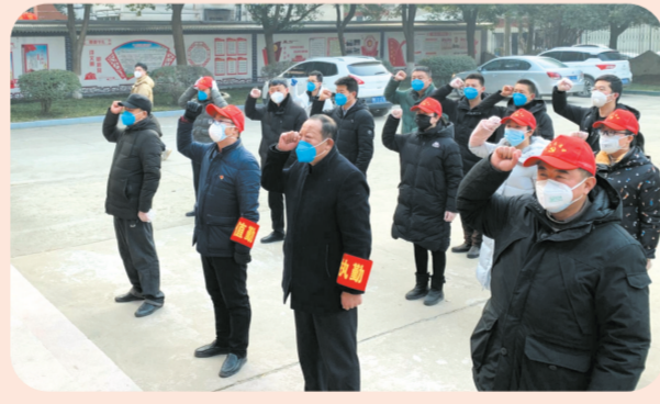
▲南郊街道机关党支部党员面对党旗重温入党誓词