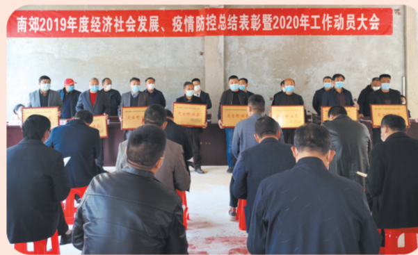
▲南郊街道办事处召开2019年经济社会发展、疫情防控总结表彰暨2020年工作动员大会