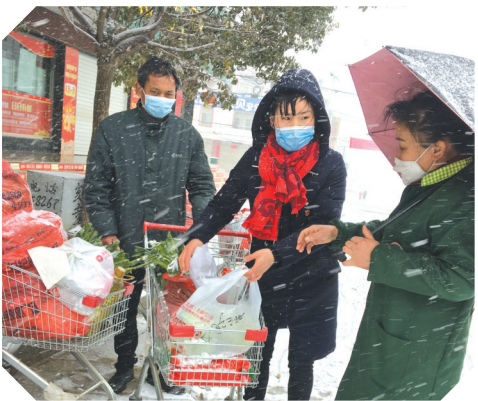
▲ 随县高城支局工作人员顶风冒雪为当地居民购买生活物资

疫情无情人有情。随县邮政勇敢逆行,冲锋在前,将为民服务延伸到抗疫一线、田间地头,用实际行动充分践行“国家有要求,邮政挑重担”的庄严承诺。