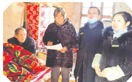
▲ 随县新城支局上门为客户办理社保卡激活

“始于感恩,臻于感动”。将服务送上门,让“特殊”的客户享受到“特殊”的服务,这在随县邮政各网点已经成为常态化工作。下一步,随县邮政将进一步健全服务机制,细化措施,为客户提供更加便捷、贴心、高效的延伸服务。