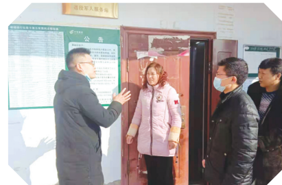
▲ 随县新街支局在各村张贴延伸服务公告并现场讲解具体流程