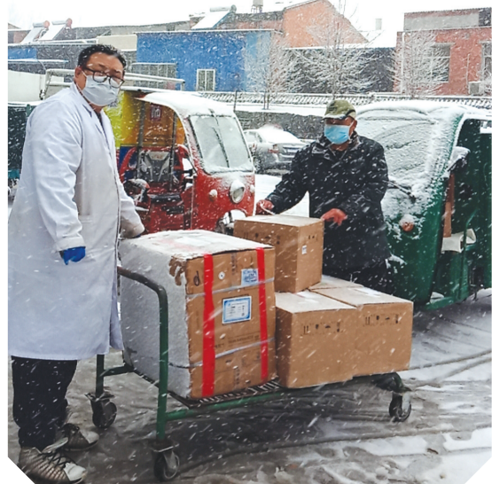
▲ 疫情期间,随县厉山支局投递员将防疫物资送到抗疫一线

今年是决胜全面建成小康社会、决战脱贫攻坚之年,也是“十三五”规划收官之年,面对突如其来的新冠肺炎疫情,随县邮政勇于担当,迎难而上,用实际行动践行“人民邮政为人民”的初心使命,逆行而上,抗击疫情,优质服务惠及民生,创新驱动城乡融合发展,以“国家队”的责任和担当,让为民服务触角延伸到千家万户。