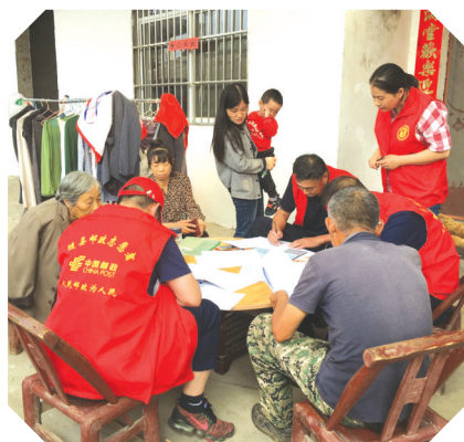
▲ 随县邮政机关党员送金融知识下乡

随县邮政进一步延伸服务触角,通过“上门服务”解决特殊客户群体社保卡激活“最后一公里”。全县各网点广泛张贴延伸服务公告,对网点营业人员“特殊客户群体延伸服务”办理流程及社保卡相关业务知识强化培训,提升全员主动服务意识;对全县社保卡客户进行再梳理,筛选出80岁以上且未激活的社保卡客户逐一上门走访,了解客户需求,预约上门服务时间;到各村村委会收集其他因行动不便等特殊原因不能到网点办理特殊业务的客户信息,通过短信、电话、上门等方式预约柜台延伸服务时间;对因个人原因需到网点办理业务的客户,各网点配备轮椅、老花镜、座椅等辅助设施,满足客户个性化需求,有效提升客户满意度。