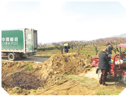
▲ 为助力复工复产,随县厉山支局投递员全员上阵,将农资送至田间地头