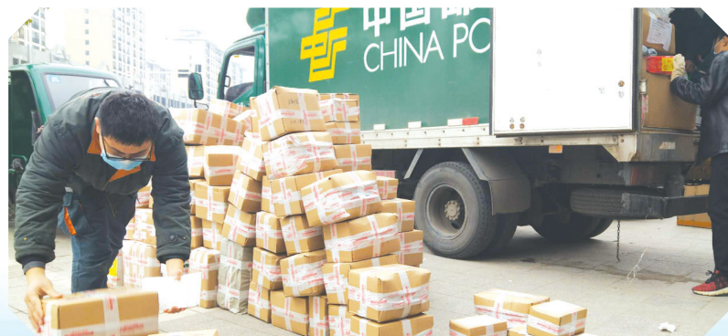
▲ 随县厉山支局为客户收寄农特产品

风起云涌正当扬帆起航,任重道远更需策马扬鞭。随县邮政将继续秉承“人民邮政为人民”的服务宗旨,探索服务新模式,丰富服务新内涵,持续提升网点服务效能,更好地为民服务延伸到基层的每一段“神经末梢”,推进文明实践遍地开花。