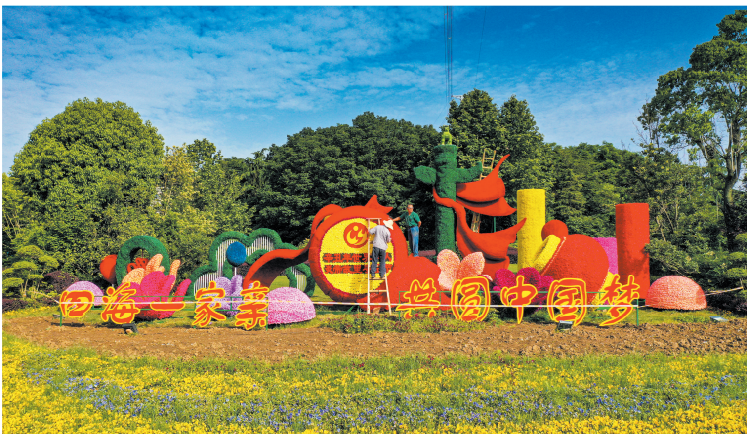
5月24日,园林工人正在市政府北坡布置辛丑年世界华人炎帝故里寻根节新景观,营造浓厚的节日氛围。