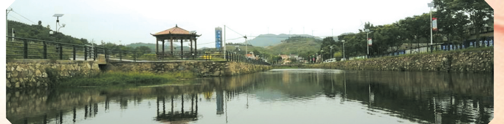
▲ 广水财政所先后整合财政资金500多万元,加快土门村“一河两岸”建设,助力乡村振兴

行程万里,不忘初心。广办财政人将以党的十九大精神为统领,抓实党建工作,牢记“为国聚财、为民理财”宗旨,撸起袖子加油干,铸魂固本阔步行,以时不我待的精神书写基层财政事业的新时代。