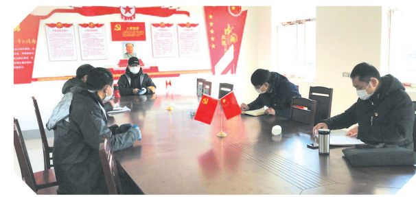
▲ 召开“双评双治双促”推进会