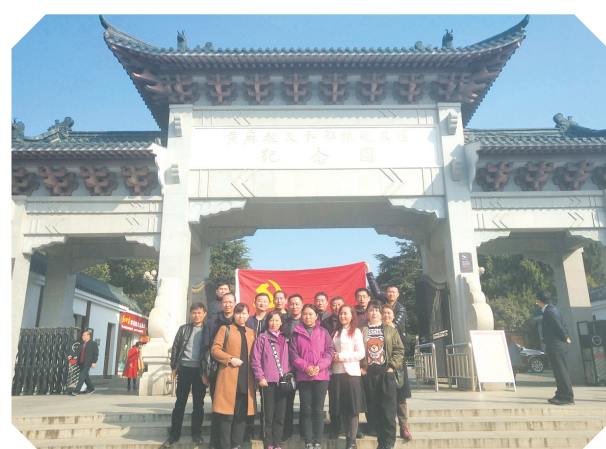
▲ 组织全体干部职工赴红色教育基地,开展革命传统教育