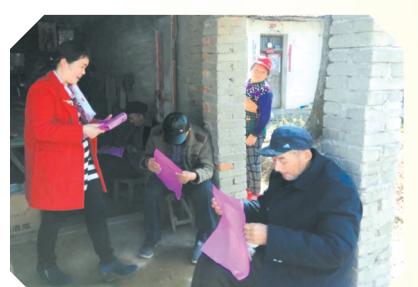
▲ 进村入户宣传党的惠民政策