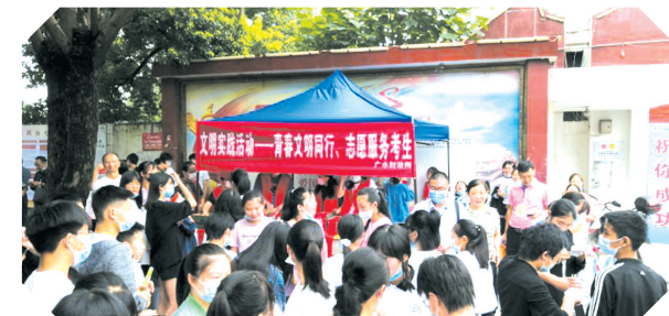
▲ 开展文明实践活动