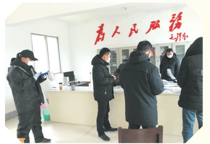
▲ 邀请“两代表一委员”对文明服务进行视察

开展惠农政策宣传,保民生顺民意。为认真开展惠农政策宣传,确保党的各项惠农政策落到实处,该所组织财政专管员认真学习各项惠农政策,将党和国家的惠农政策送进千家万户,让群众切实体会到党和政府的关怀和温暖。利用财政所电子屏滚动宣传惠农政策,刷写固定标语80条,制作横幅42条;通过进村入户发放宣传单5000份,提高了群众的知晓率和参与度。在惠农资金的发放过程中,严格执行政策,严格发放程序,切实做到“两不准、四到户”,按时完成了对4729户耕地地力保护资金的面积申报工作,2020年度耕地确权面积15989.55亩,发放耕地地力保护补贴资金111.58万元。