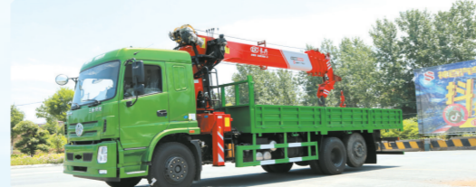
▲三环T280昊龙驾驶室气囊桥上装长12吨直臂式吊机