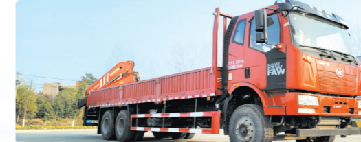
▲解放J6排半驾驶室后双桥上装三一7.7吨折臂(尾吊、计量检测车)