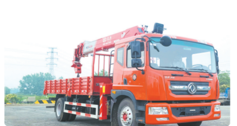
▲东风多利卡D9排半驾驶室单桥上装长8吨直臂式吊机

用汽车制造企业，国内知名石油化工、园林绿化、市政环卫、公路工程专用汽车制造商，现已具备年产10000台专用车的生产规模，并先后通过ISO9001-2000国际质量管理体系认证和国家3C认证。集团公司先后被金融机构评为AAA企业，被湖北省工商局评为“守合同重信用”企业，被市委、市政府授予“随州市优秀民营企业”称号。生产产品有：随车起重运输车(随车吊)、汽车起重吊(汽车吊)、挖掘机平板运输车、冷藏车、多功能洒水车、多功能扫路车、垃圾运输车、高空作业车、吸污车、吸粪车、道路清障拖车、各种半挂车、全挂车等系列专用汽车。公司自成立以来，一直秉承“一流的产品、一流的质量、一流的服务”经营理念，依托汽车改装之都的生产技术优势，全心致力于各类专用汽车和新能源特种车辆的研发生产。