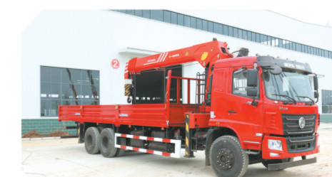
▲东风华神F5驾驶室后双桥上装三一12吨直臂式吊机