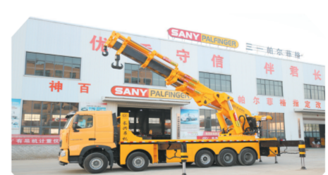
▲国六重汽豪沃五轴上装长130吨汽车起重机