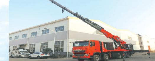
▲国六重汽豪沃五轴上装长83吨汽车起重机