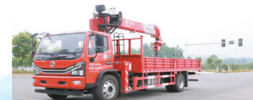
▲国六东风多利卡D9单排上装长8吨直臂式吊机