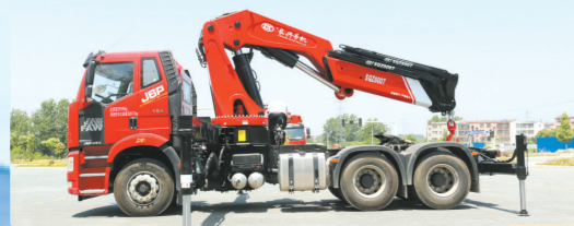
▲解放J6L牵引头上装长30吨臂式吊机