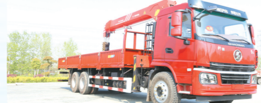
▲陕汽轩德翼6后双桥上装三一12吨直臂式吊机