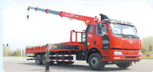
▲解放J6L后双桥上装三一12吨直臂式吊机