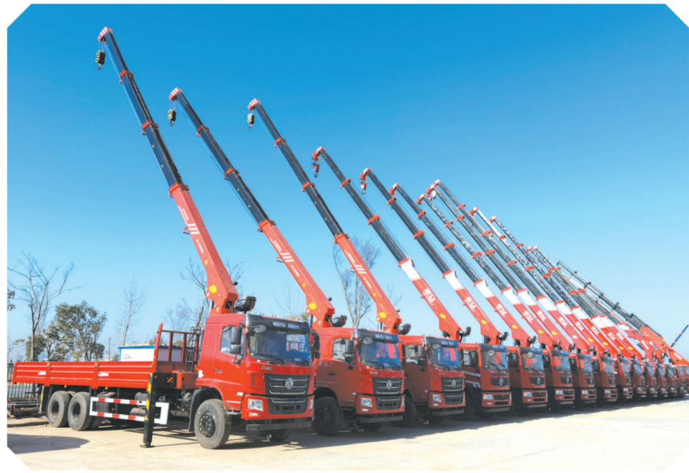
▲东风华神F5驾驶室后双桥上装长12吨直臂式吊机