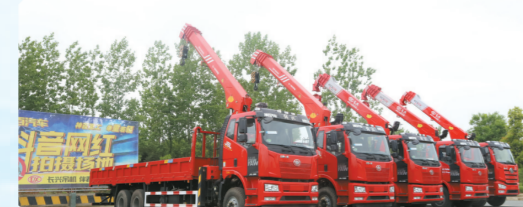
▲解放随车吊大集合