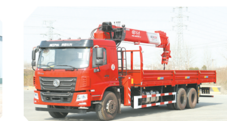
▲东风华神F5驾驶室后双桥上装长12吨直臂式吊机