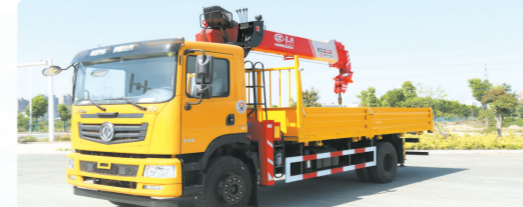
▲东风华神T5质尊版单排驾驶室单桥上装长8吨直臂式吊机