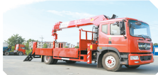
▲东风多利卡D9排半驾驶室单桥上装长8吨直臂式吊机(带爬梯)

2018年，公司生产5000台专用汽车，实现销售收入12亿元。2019年公司生产7000台专用汽车，实现销售收入17亿元。