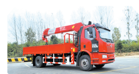
▲解放J6L单排驾驶室单桥上装长8吨直臂式吊机