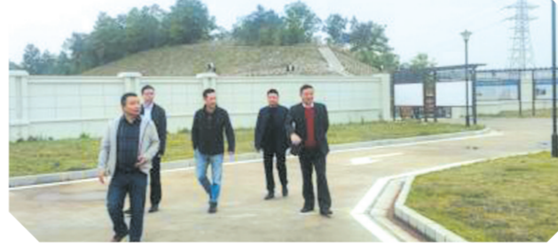
▲ 局招商专班一行走访招商投资企业

实各项惠企纾困政策,通过综合考核等方式对13家“2020年度突出贡献企业”直接奖励资金84万元,支持企业做大做强;对33家外贸出口企业奖励资金731.51万元,鼓励企业出口创汇;对3家企业补助388万元,助推全县农商互联农产品供应链发展;为3家企业争取到激励性县域经济高质量发展资金500万元。