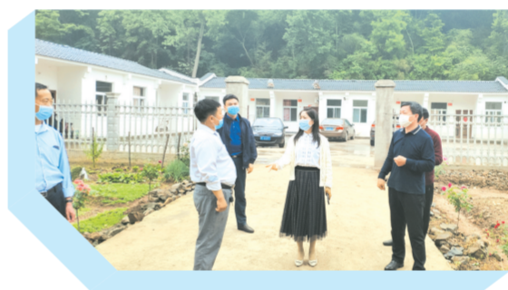
▲ 深入三里岗毛家冲村查看易地扶贫搬迁建设及入住情况