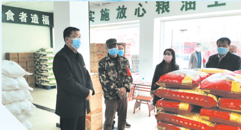
▲ 疫情期间,随县县委书记陈兴旺调研粮油保供情况