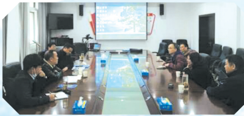
▲ 局招商专班与乐福国际慈善基金会(亚太区)召开“华夏故园”项目洽谈会

栽下梧桐树,引得凤凰来。随县财政局正瞄准营商环境中的痛点、堵点,打通关键环节壁垒,不断深化“放管服”改革,扎实开展服务提升行动,努力实现流程最优、体制最顺、机制最活、效率最高、服务最好目标,为打造“汉襄腹地、神韵随州”贡献随县财政力量。