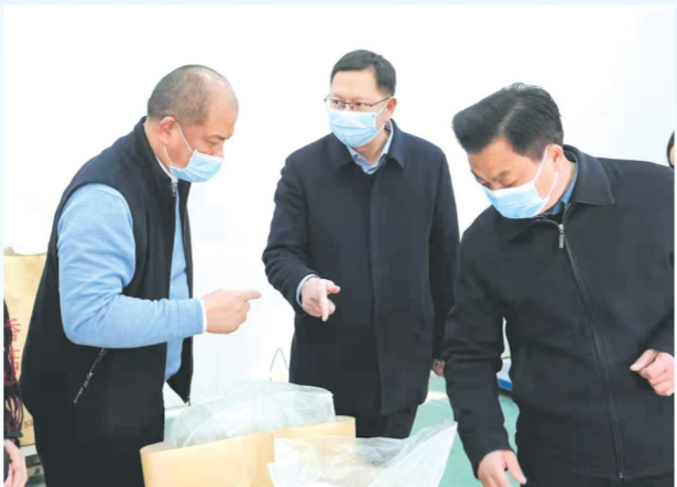
▲ 随县委副书记、县长陈武走访调研重点项目建设和企业发展