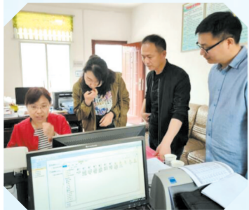
▲ 随县财政局监督检查专班人员到各直属单位开展财政票据监督检查