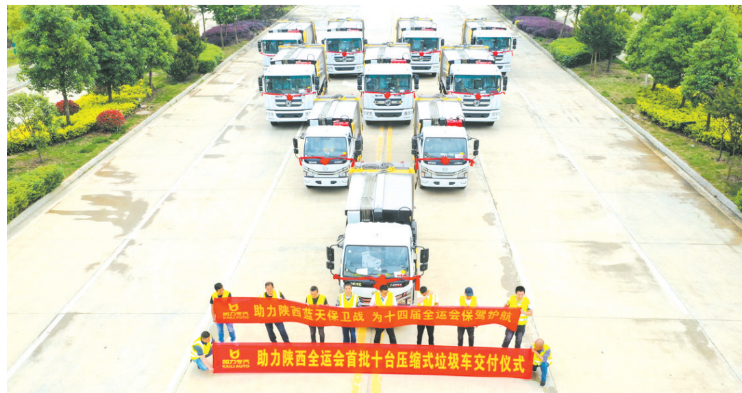
“用实力解决行业痛点,用专业赢得回头客。”近日,凯力专汽首批10台压缩式垃圾车顺利交付,助力陕西蓝天保卫战和第十四届全运会。

随州新闻网: http://www.suiw.cn 随州论坛: http://www.szbbbs.org