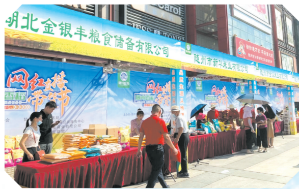
▲ 随州香稻品牌发布会暨网红带货节在大润发广场举办