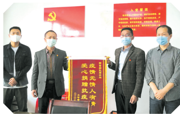
▲ 社区感谢区商务局在疫情期间捐赠防疫生活物资

曾都区商务局将以时不我待的精神推进“七项重点工作”,深入实施“十大示范行动”,持续落实六稳六保要求,努力为全区商务经济发展做出新的贡献。