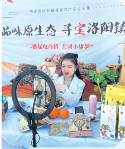
▲ 首届电商节上网红直播带货

转型升级,推动企业集聚发展。依靠技术升级和产品创新,引导企业开拓适合市场需求的优质产品。以原木童公司为代表的食用菌出口企业,转型升级成功后,外贸出口达到3688万美元,企业效益大幅增长。另外,绿美宝、三泰食品、麒泉泉、鹏来科技等4家企业新建、改建香菇生产加工线20多条,发展香菇酱、香菇咖喱、香菇浓缩汁、香菇清水罐头等深加工产品,开发香菇多糖、氨基酸等保健食品和药品,备受市场青睐。