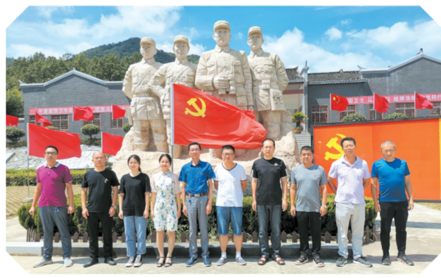
▲ 组织机关党员干部赴九口堰革命纪念馆开展党性教育