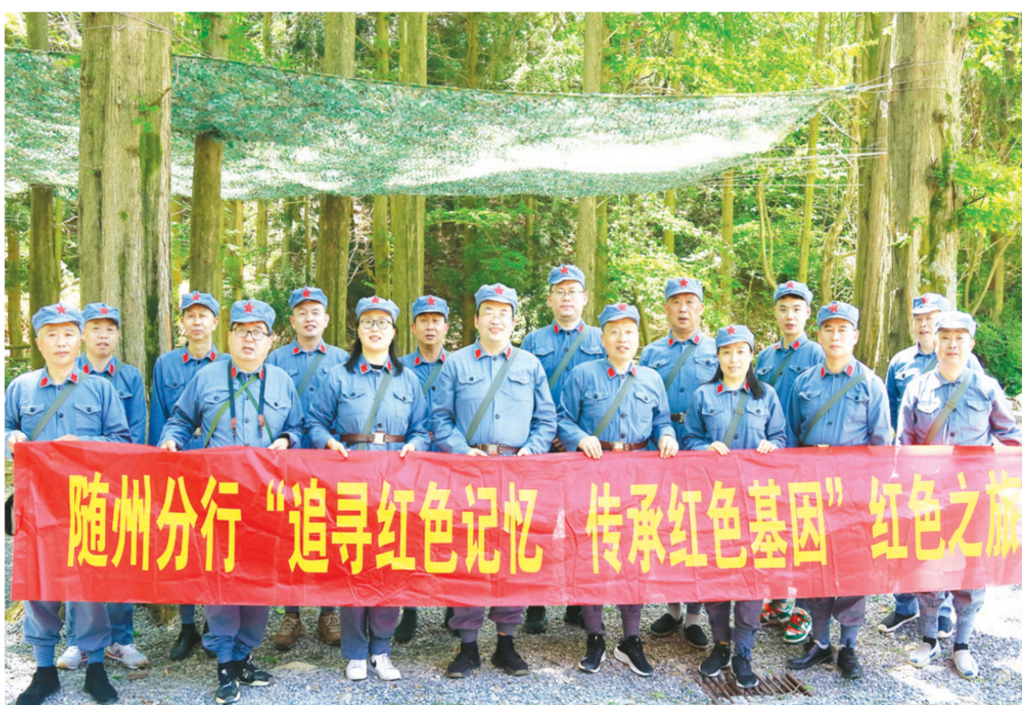
▲ 近日,工行随州分行办公室组织员工到大洪山开展“追寻红色记忆,传承红色基因”红色之旅,让党史学习教育活起来,进一步激发工作热情,凝聚奋进力量。

珍惜革命先辈为我们创造的美好生活,时刻不忘自己的“第一身份”,倍加珍惜本职岗位并充分发挥好党员的先锋模范作用,扎实开展党史学习教育,传承红色基因,从党的百年伟大奋斗历程中汲取奋勇前行的智慧和力量,以党建引领业务高质量发展,以实际行动和优异成绩向建党100周年献礼。