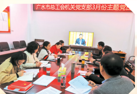
▲ 支部主题党日活动