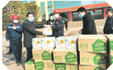
▲ 向留在广水过年的外籍职工发放慰问物资

暑降温物资;开展“金秋助学”活动,向62名困难学子发放助学金24.4万元;开展“冬送温暖”活动,向建档立卡的72名城镇困难职工发放生活帮扶和医疗帮扶资金48.63万元;为5名职工办理小额贷款60万元,新建户外职工“爱心驿站”2处,爱心母婴室1处。落实城镇困难职工脱贫解困政策,顺利通过湖北省总工会第三方评估和全国总工会对广水市城镇困难职工脱贫解困复评。 新时代开启新征程,新时代呼唤新作为!站在新的历史起点上,广水市总工会将以“不到长城非好汉”的初心、“咬定青山不放松”的恒心、“踏平坎坷成大道”的信心,团结动员全市职工,围绕中心、服务大局,努力为推动广水市高质量发展作出新的贡献。