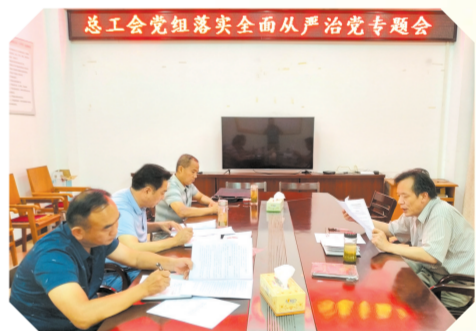
▲ 研究落实全面从严治党的专题会议