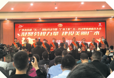
▲ “广水工匠”选树表彰