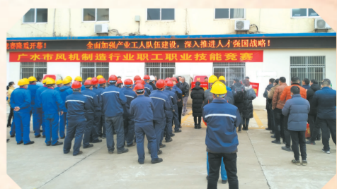
▲ 广水市风机行业劳动技能竞赛活动