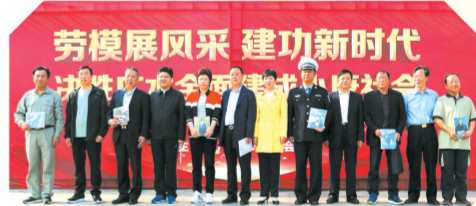
▲ 劳模展风采、建功新时代活动