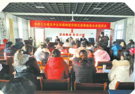
▲ 十九届五中全会精神进企业宣讲活动