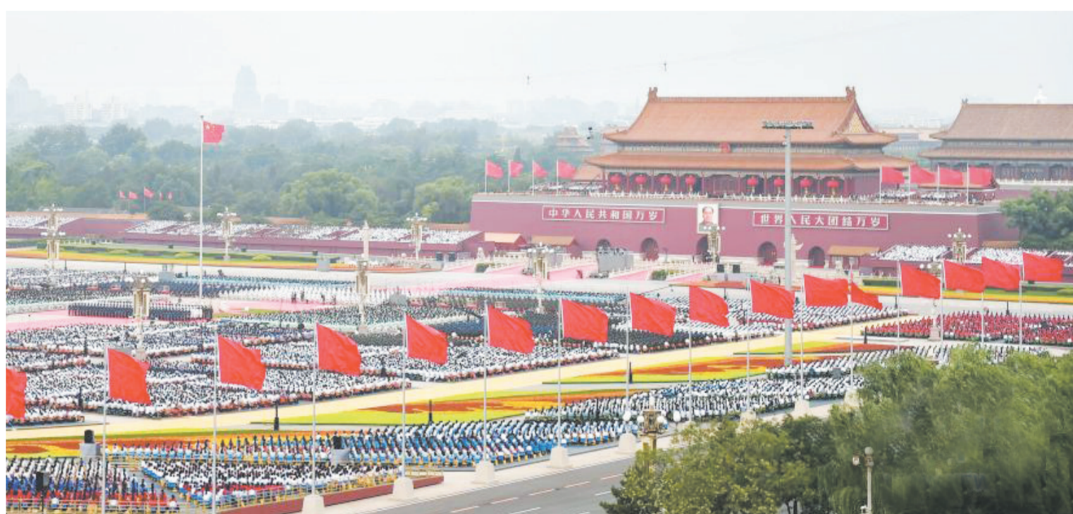
7月1日上午,庆祝中国共产党成立100周年大会在北京天安门广场隆重举行。

新华社北京7月1日电 百年征程波澜壮阔,百年初心历久弥坚。7月1日上午,庆祝中国共产党成立100周年大会在北京天安门广场隆重举行,各界代表7万余人以盛大仪式欢庆中国共产党百年华诞。中共中央总书记、国家主席、中央军委主席习近平发表重要讲话。他强调,过去一百年,中国共产党向人民、向历史交出了一份优异的答卷。现在,中国共产党团结带领中国人民又踏上了实现第二个百年奋斗目标新的赶考之路。中国共产党立志于中华民族千秋伟业,百年恰是风华正茂。回首过去,展望未来,有中国共产党的坚强领导,有全国各族人民的紧密团结,全面建成社会主义现代化强国的目标一定能够实现,中华民族伟大复兴的中国梦一定能够实现。