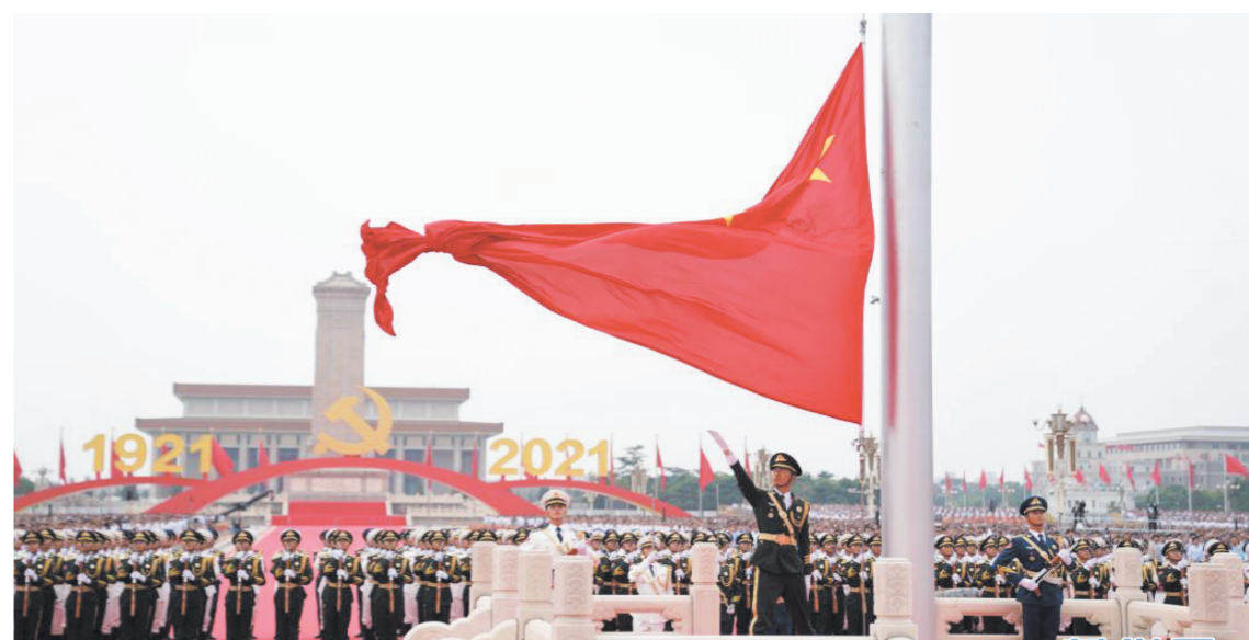
「月一日上午,庆祝中国共产党成立100周年大会在北京天安门广场隆重举行。图为升旗仪式。

国内统一刊号: CN42—0026 邮发代号: 37—52 E-mail: szrbs@21cn.com