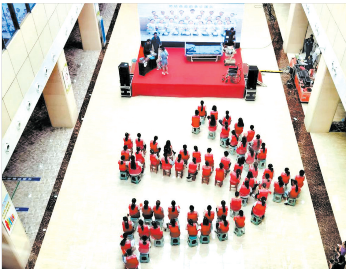
在中国共产党喜迎百年华诞,举国上下深入学习习近平总书记重要讲话之际,七月六日上午,随州市中心医院在文帝院区门诊大厅隆重举办“颂歌献给党、奋进新时代”“嘉乐杯”护患沟通情景剧大赛。

该院制定了《消防安全应急预案》,各科室签订了《消防安全责任书》。在全院划区分设消防责任小组并挂牌公示,设置多处“消防安全小提示”警示牌,并多次邀请随州公安消防中心警官来院授课培训。在全院开展消防安全专项检查行动,重点检查了消防器材、设施的维护管理,对重点部位病房、食堂、检验实验室、中心供氧室、病室室、消毒室、被服房、配电房、电梯机房等进行排查,排查了电线线路是否有超功率使用及老化现象,巡查了安全疏散通道、安全出口是否畅通,检查了疏散指示标志、应急照明装置是否使用正常等。