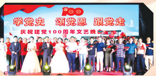
▲ 市市场监督管理局联合“小个专”经济组织举行庆祝建党100周年主题文艺晚会

坚持专题党课带动学。坚持领导带头、率先垂范,充分发挥“关键少数”的示范带动作用。安排领导班子成员、支部书记和先进典型,在“七一”前后讲授一次党史学习教育专题党课。并把学习教育情况纳入年度考核、党建工作述职评议考核内容,作为民主评议党员的重要依据。