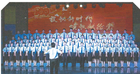
▲ 市市场监督管理局参加“放歌新时代 颂歌献给党”全市庆祝中国共产党成立100周年合唱汇演