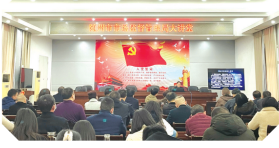
▲ 市市场监督管理局大讲堂活动