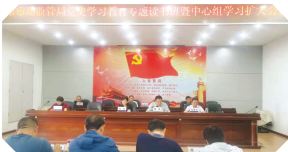
▲ 市市场监督管理局党史学习教育专题读书班暨中心组学习扩大会议

突出组织建设,夯实机关党建工作基础。坚持做到统一支部组织架构,统一每月党日活动,统一党员活动记载,坚持党员领导干部双重组织生活制度,对各支部落实“三会一课”、主题党日等制度,实行月度督查、季度通报、年度考核,一体推动党的组织生活“三量齐升”。突出创先争优,党群联动全面塑造市监新形象。结合市场监管行业特点,开展了“建功新时代、机关作表率”“心向党·健步走”“岗位争标兵、巾帼展风采”“感恩恩、听党话、跟党走”和“青春心向党、建功新时代”主题实践活动,市局被国家市场监督管理总局授予“全国市场监管系统抗击新冠肺炎疫情先进集体”称号,系统2人被授予“全国市场监管系统抗击新冠肺炎疫情先进个人”称号,1人被国务院食品安全委员会表彰为“全国食品安全工作先进个人”,3人荣获“随州市抗击新冠肺炎疫情先进个人”称号,2人获评“随州市优秀共产党员”,1人获评“随州楷模”,1人被推荐为“湖北抗疫消费维权人物”,市局直属机关委员会被市委授予“全市先进基层党组织”称号,市局12315投诉举报指挥中心被市总工会授予“随州市工人先锋号”称号。积极开展文明单位、文明行业、新时代文明实践先进等创建活动,下属4个事业单位均获得市级以上文明单位,市局机关获评湖北省文明单位。