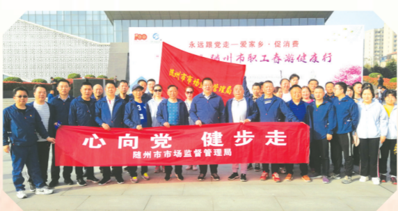
▲ 市市场监督管理局干部职工参加“心向党 健步走”健康日活动