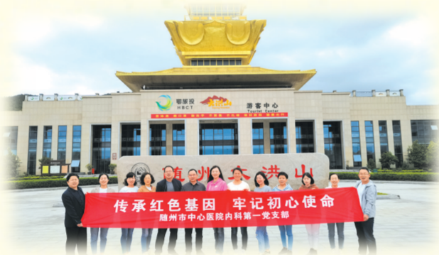
▲ 市中心医院内科第一党支部