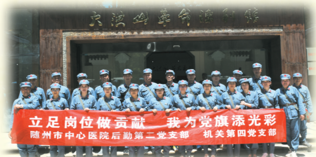
▲ 立足岗位做贡献 我为党旗添光彩