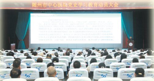
▲ 党史学习教育动员大会

凡是过往,皆为序章。党的建设永远在路上,抓党建就是抓发展,强党建就是聚人心。今后,随州市中心医院将持续推动党建工作与医院发展深度融合,强化党员示范引领作用,打造老百姓满意的医院,给患者提供更优质高效的医疗服务。