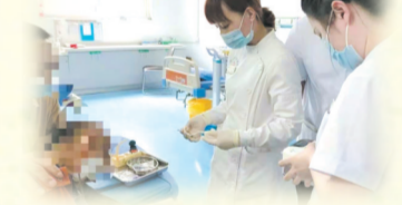
▲ 多学科合作让癌症患者远离疼痛