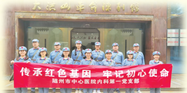
▲ 传承红色基因 牢记初心使命