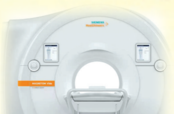
▲ 引进3.0T磁共振,提升医院影像诊断水平