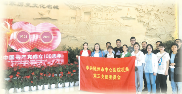
▲ 随州市中心医院机关第三党支部

建强组织强队伍。医院不断扩大基层党组织覆盖和工作覆盖,努力打造政治素养高、业务能力强、精神面貌新的党员队伍,充分发挥基层党组织的战斗堡垒作用。着力加强标准化党支部建设。推行“支部建在科室”,实现行政管理、日常事务与党务工作有机统一,党支部由11个增至24个,把党的组织和工作无空白、无遗漏地渗透到每个科室,每一名医务人员,构建了“党委—支部—科室—党员”全覆盖垂直管理体系。选树红旗党支部,创建情况作为每季度检查重点,不断改进,全面提升支部建设质量。多举措让党建与业务实现同向而行。坚持同步安排党建与业务学习活动。在支部主题党日活动中设置部分业务学习内容,重点学习医德医风、先进人物、优质服务等方面的业务知识,专题讨论如何提高科室服务水平、征求意见建议为主,让业务培训和党务培训同步推进,做到时间上同安排,考核上同要求。细化量化党支部工作考核办法,把医德考评、职称晋升、职工年度考核等工作纳入党支部管理,赋予支部权力,做到权责对等,增强支部凝聚力,以考评促进党建效果,推动党员干部党建主体责任全面落实。