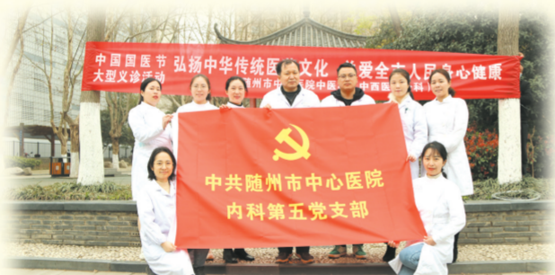
▲ 市中心医院内科第五党支部