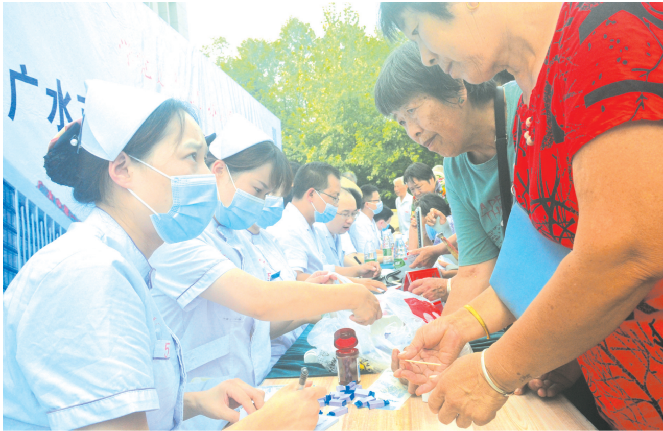
近日,广水一医院组织医疗专家团队深入马坪镇街道开展“我为群众办实事”大型义诊活动...