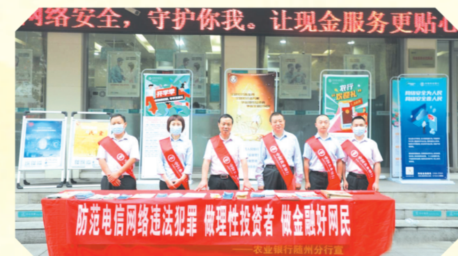
▲ 开展反电诈金融知识宣传