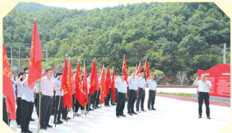
▲ 在红军纪念碑下重温入党誓词

与此同时,随州农行着力加强“三大阵地”建设,努力打通党史学习教育“最后一公里”。加强“文化阵地”建设,打造“宣传有载体、展示有窗口、学习有园地、阅读有场所、交流有空间”的党建文化阵地;加强“一线阵地”建设,为党支部、图书柜添购书籍资料,切实将党史学习教育的触角延伸到基层;加强“网络阵地”建设,通过网点LED屏、微信群客户群及朋友圈等网络平台宣传党的知识、传递党建动态,提高党史学习教育的吸引力。