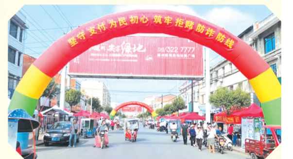
▲ 随州农行承办全市金融部门“反电诈、反洗钱知识乡镇行”活动

电信诈骗,一直被群众深恶痛绝。随州农行进一步筑牢安全防线,持续开展防范电信网络诈骗宣传活动,提高人民群众的自我防范意识。不断创新个人涉案账户“3746工作法”,即账户开立三必审、可疑情形七关注、电子渠道四严控、后续管控六落实,出台柜面拦截电信网络诈骗奖励管理办法,切实提高该行员工治理电信网络诈骗工作积极性和有效性。4月下旬,该行在反诈工作中成功协助公安机关端掉一电信诈骗团伙洗钱窝点,受到市公安局致信表扬。今年以来,该行柜面已成功拦截疑似涉嫌诈骗开户及转账事件10余起,有效保护了人民群众的资金财产安全。