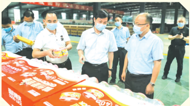
▲ 到香菇加工、出口企业调研,提供金融服务