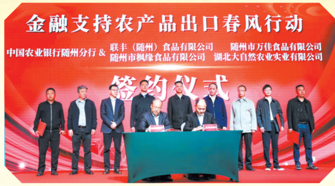
▲ 金融支持农产品出口“春风行动”启动仪式上,农行与农产品出口企业签约