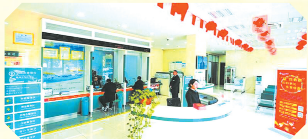
▲ 温馨亮丽的“暖心厅堂”