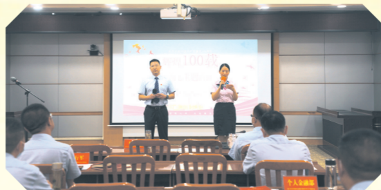
▲ 随州农行举办庆七一“奋进新时代 逐梦新征程”演讲比赛