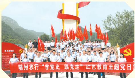
▲ 开展“学党史 跟党走”主题党日活动