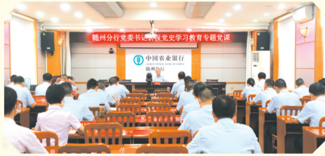
▲ 党委书记讲授党史学习教育专题党课