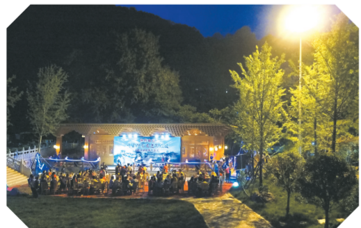
▲ 星空、月光下的自在聚会

大洪山是一处天然氧吧。这里气候温和,冬暖夏凉,四季分明,气候宜人,空气中富含氧离子,具有“一山分四季,十里不同天”的气候特点,年平均气温在10.6℃~15.3℃,年均相对湿度77%,是旅游避暑的绝佳胜地。幽泉修竹,千年银杏、古寺佛塔等景近在咫尺,与置身都市喧嚣判若两境。大洪山史志更有“苍松翠柏长生地,绿水青山古洞天”的记载。