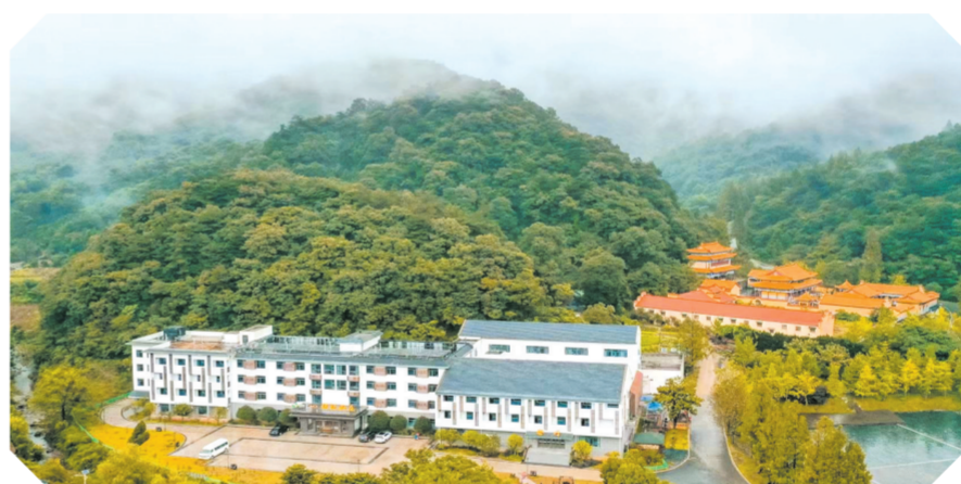
▲ 大洪山自在谷酒店B区(绿林山庄)

久在樊笼里,复得返自然,随心所欲地,自在大洪山。在楚北天空第一峰,在高山白龙池畔,在洪山禅寺外,在千年古银杏树下,让我们一起走进自在谷,寻梦大洪山。