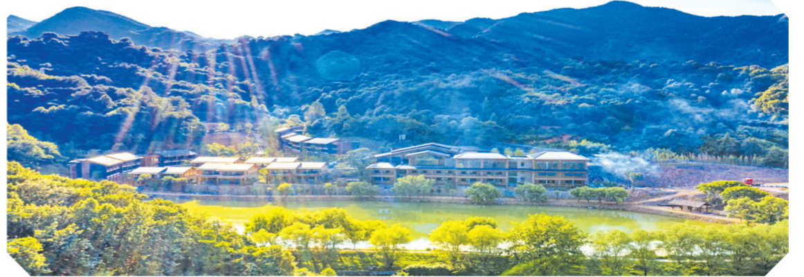
▲ 大洪山自在谷酒店C区