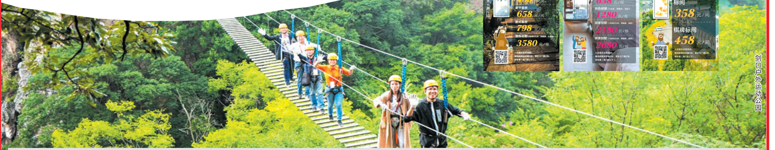
剑口户外运动公园