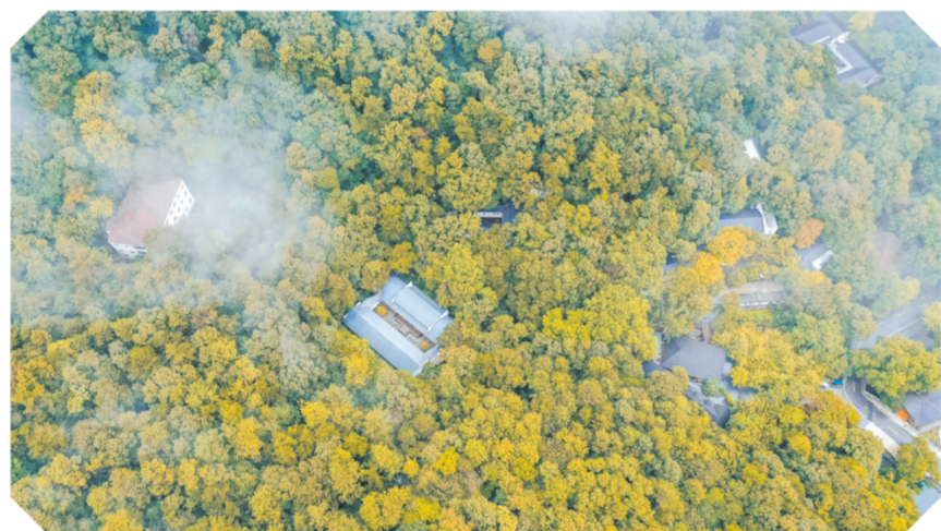
▲ 大洪山自在谷酒店A区(筱泉湾度假村)