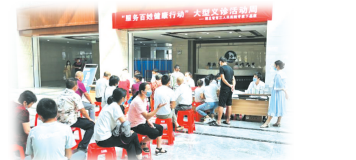
▲ 开展服务百姓义诊活动

建设抓病媒生物防制。多途径宣传动员,从及时清理垃圾、堵塞老鼠洞、雨后及时清积水、修补更换灭蚊门帘窗纱等细微之处,时刻提醒市民群众养成良好的卫生习惯。截至目前,高新区管委会共投入30余万元更换下水道盖板、补充毒饵站等,完善病媒生物防制设施,科学组织“四害”药物消杀。 创卫工作是一项社会系统工程,贵在持之以恒。高新区将坚持杜绝“一阵风”突击搞创建,切实久久为功,在实践中不断夯实机制,凝聚全民创卫的强大合力,持续开展环境卫生整治,多措并举筹集资金抓投入,以点带面、示范带动,力争“一年大见成效、两年全面达标、三年争创成功”,保障人民群众健康,营造良好发展环境。