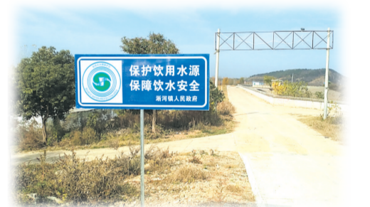
▲ 设置饮用水保护标识

乡村振兴战略规划(2019—2023)》《随州高新技术产业开发区美丽乡村建设五年推进规划(2019—2023年)》,开展生活垃圾治理和人居环境整治三年行动,累计投入资金1060万元用于浙河镇44个村(社区)美丽乡村建设规划编制,目前已完成5个示范村和15个整治村规划编制。坚持生态宜居,全面推进生活垃圾治理,每年投入资金1000万元用于浙河镇垃圾处理、环境综合整治。全面完成厕改三年攻坚任务,累计投入资金1562万元,改造农村户厕8541所,农村公厕49座,城镇公厕9所,引导农户自建卫生厕所3772所,浙河镇卫生厕所普及率达86%以上。抓好乡村建设行动,多渠道统筹整合资金3600万元,用于完善农村基础设施,着力推进浙大线、浙魏线3个示范村及7个整治村美丽乡村建设,打造一批美丽乡村建设示范点。