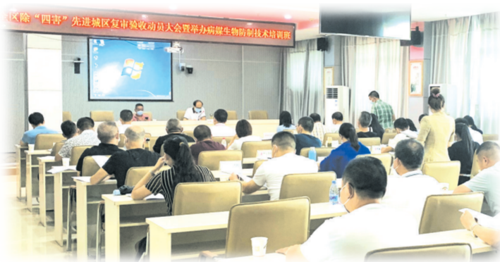
▲ 高新区病媒生物防治培训会

所谓美丽街区,要求的不仅是街道的干净整洁,更是整个居住环境的再提升,是城市文明的标志。高新区精心组织人员,全面开展综合整治,给市民一个绿色宜居家园。 对“美丽街区”范围内的大街小巷持续开展市容环境整治16次,杜绝占道经营、沿街叫卖,保障道路通畅,对重点部位安排执法人员值守,联合城管执法、公安交警、市场监管等部门,开展交通整治,确保了美丽街区秩序井然有序。在解放东路、胜利路、红星路、文化公园路等路段采取人机配合模式,加大道路清扫保洁频次,着重清扫主、次干道顽固污渍,对因暴雨和施工车辆带泥上路造成污染较严重的位置,集中环卫工人配合洒水车车辆进行分段清洗,确保路面干净,还原本色。对主要路段两边的杂物、石块、枯枝及小广告等进行集中清理,并建立长效机制,安排专人不间断巡查,对新发现的环境卫生问题及时处置,确保卫生死角不反弹。对美丽街区,加强日常巡查管理,坚决防范和遏制安全事故的发生,对街区实施全面检查,严格管控。应急措施齐全。利用高压冲洗车对园区的大、小垃圾箱及垃圾分类箱进行全面清洗,去除箱子表面污垢,保持垃圾箱干净、卫生。对美丽街区范围内的园林绿化进行排摸式全面清理,消除日常管护死角,创造干净、整洁优美的绿化环境;精心做好季节性养护措施,提升城市园林景观效果。 同时,高新区浙河镇重拳出击,开展美丽乡村建设暨“擦亮小城镇”行动,将环境综合整治作为工作重点来抓,千群齐心协力,使镇城环境整治取得阶段性成效。