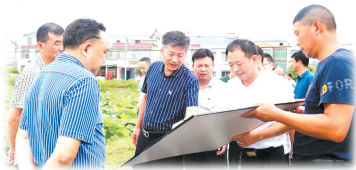
▲ 高新区领导调研美丽乡村工作

市容市貌体现一个城市的“精气神”。漫步在随州高新区会发现,道路整洁、小区干净、市场有序……讲卫生、爱清洁的良好社会风气愈加浓厚。 自我市“国家卫生城市”创建工作启动起,随州高新区自觉把创卫当成一项惠及群众的民生工程,举全区之力、聚万众之心,着力建机制、强投入,宣传发动广大干部群众齐动手,以“实”字为基、“细”字为要,扎实开展病媒生物防制工作,有效改善城乡人居环境,致力于让群众有更多的获得感、幸福感和归属感,打造更加和谐、宜居、有温度的魅力高新区。