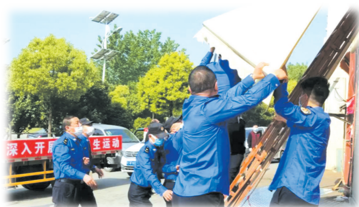
▲ 城管执法队员拆除违章户外搭建