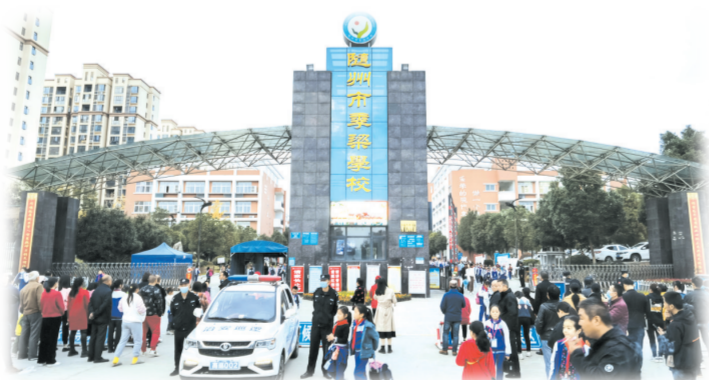
▲ 季梁学校交通秩序井然

镇区方面,出动综合执法队对存在乱搭乱建、乱堆乱放、乱设摊点、乱拉乱挂等不文明行为进行大力整治,清理了大量的木柴、杂物、垃圾等物品,主干道、内街小巷、门前屋后的“脏乱差”问题得到有效根治,城镇面貌焕然一新。截至目前,共整顿废品回收站5处、榨油店5处、建筑器材4处,整顿占道经营60处,拆除违建建筑130平方米,清理乱堆乱放杂物80余处、垃圾死角40余处、废旧横幅120余条、广告牌90余块,有效整治了镇区道路两侧的环境卫生、交通秩序、经营秩序乱象。 乡村方面,重点围绕村庄房前屋后垃圾、水体、墙体路面以及乱搭乱建、乱堆乱放等开展环境卫生大整治。美化、大堰坡片美丽乡村示范片,沿线各村(社区)行动迅速,聚焦墙面立面整洁,集中清理小广告、“牛皮癣”、刷白墙面;聚焦水体清澈明亮,加强河流湖泊、水库堰塘的水体清污,清理岸边杂草;聚焦道路硬化,对路面破损进行修补,对沿路柴草进行清除;聚焦村庄整洁有序,号召全民总动员,以农户家庭为单位开展大扫除,对房前屋后垃圾进行清理,改变之前“脏、旧、乱、挤”现象,努力打造“洁、绿、亮、美”新面貌。