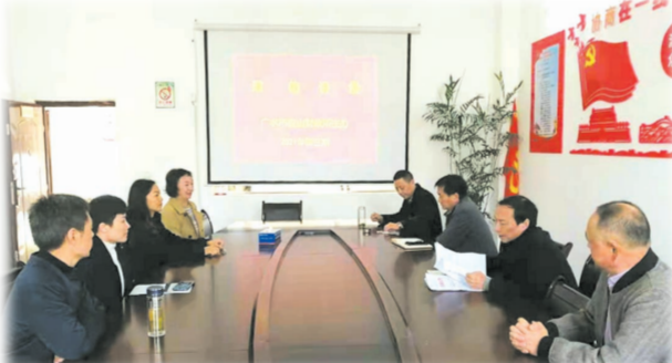
▲ 举办“道德讲堂”活动