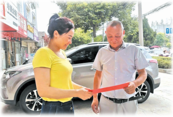
▲ 开展惠农政策宣传