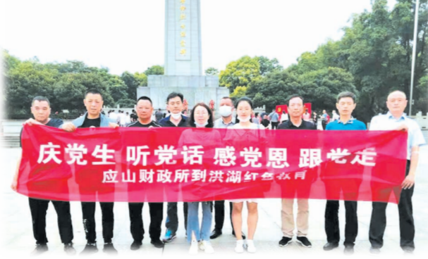
▲ 赴红色教育基地进行革命传统教育