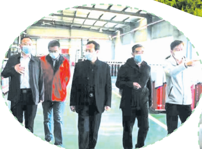
▲ 组织班子成员深入企业调研

今年以来,应山财政所在广水市财政局和应山街道党工委、办事处的正确领导下,以党的十九大精神为指导,深入开展党史学习教育,牢固树立聚财为公、理财为民的理念,勠力同心,砥砺前行,全力保运转、促发展、保民生,为促进应山街道经济社会健康平稳发展作出了应有贡献。