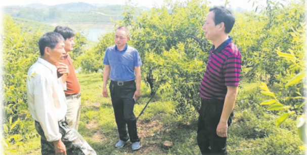
▲ 深入基地指导生产