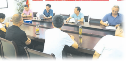
▲ 组织党员干部学习党史

与此同时,应山财政所着力加强“三大阵地”建设,努力打通党史学习教育“最后一公里”。加强“文化阵地”建设,打造“宣传有载体、展示有窗口、学习有园地、阅读有场所、交流有空间”的党建文化活动室;加强“一线阵地”建设,为图书室添购书籍资料,切实将党史学习教育延伸到每个触角;加强“网络阵地”建设,通过网点LED屏、微信群及朋友圈等网络平台宣传党的知识,传递党建动态,提高党史学习教育的吸引力。