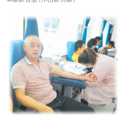
▲ 开展义务献血活动

实干促发展,实干惠民生,实干树形象。时下,应山财政人正立足本质、勤奋工作、争创一流,进一步增强大局意识、发展意识、廉洁意识,全力打造“为民、务实、高效、廉洁”新形象,为加速应山跨越发展奉献新智慧、作出新贡献。