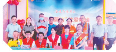
▲随州分公司联合市总工会开辟爱心驿站,为户外工作者提供便利服务