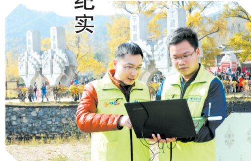
▲随州分公司技术专家检测银杏谷网络信号覆盖,全力支持文旅产业