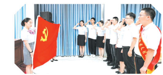
▲随州分公司开展党史学习教育,组织党员干部重温入党誓词