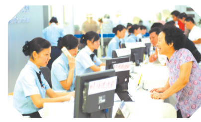
▲窗口优质服务让客户倍感亲切

落实巡视、巡察、审计整改工作,整改工作成效持续巩固。通过加强组织领导,强化责任落实,突出问题导向,科学制订整改方案,细化整改措施,严明工作纪律,