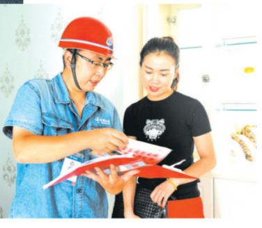
▲装维师傅为客户提供安装售后服务