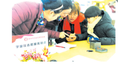
▲随州分公司开展岗位学雷锋活动,为客户提供志愿服务