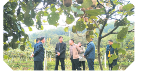
▲随州分公司积极参与乡村振兴,帮村民拓展致富路

分公司各级党组织创新性开展以“党建翼联”为品牌的联合党建活动,先后与共青团随州市委、中国人民银行随州市分行、随州市政务服务和大数据管理局、乡村振兴对口帮扶村、党员干部下沉社区、驻随部队等党政机关和企事业单位的党组织联合开展党建共建活动,密切了企地关系,提升了党建成效。