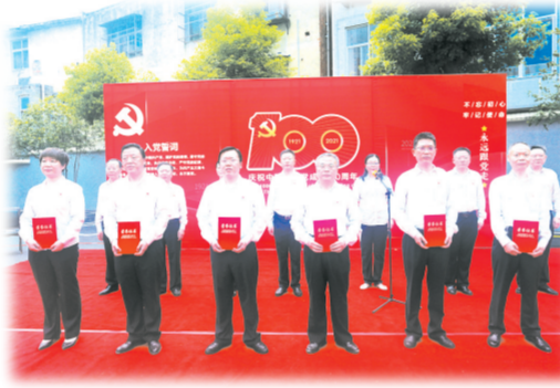
▲ 建党100周年“两优一先”评选表彰

积极对接重点项目。成立重大项目服务对接专班，采取一户一策，积极申报沟通，提升报批效率，以支持随州市支柱产业、基础设施、新能源等领域的重大项目建设为重点，做实全方位金融服务。向重大基础设施项目新增贷款4.7亿元，向新能源发电项目新增贷款5.34亿元。同时，已储备已审批或待审批各类项目20多亿元，为今年收好明年开好局做实储备，增强服务实体经济发展的后劲。