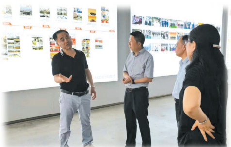
▲ 服务实体经济发展

该行积极融入我市构建“桥接汉襄、融通鄂豫、众星拱月”的发展布局，立足服务建设专汽之都、现代农港、谒祖圣地、风机名城，奋力打造全省特色增长极的目标，全力支持实体经济高质量发展，全力打造一流营商环境，为随州“十四五”开好局、起好步做出了工行贡献，体现了大行担当。 截至2021年10月末，工行本外币各项贷款余额127亿元，在四大国有商业银行中占比30.1%，较年初净增12.53亿元，在四大国有商业银行中占比32.53%，增量较同期多增2.73亿元，余额和净增额占比同业领先，各项贷款累计投放60.85亿元，较同期多投放5.67亿元。在民生领域，截至10月末，发放个人住房按揭贷款1370户，6.4亿元，存量、增量持续保持同业双第一，助力“大居民乔迁新居”。该行个人按揭贷款余额在四大国有商业银行同业占比31.31%，净增额占比70.52%，同业双第一。 在系统内，该行各项贷款增幅10.65%，全省排名第4，高出全省平均水平2.13%，信贷投放效能及规模大幅提升。 支持随州灾后重建和经济发展。积极向省行汇报，省行出台《关于加大对随州恢复灾后重建和经济社会发展支持力度的通知》。要求