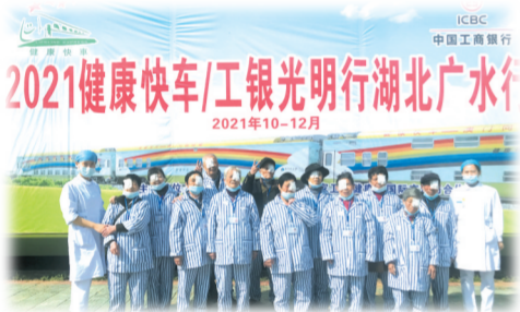
▲ 工行支持公益行动，让广大白内障患者重见光明