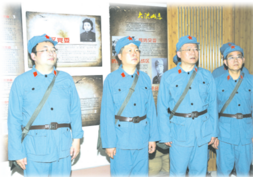
▲ 接受革命传统教育