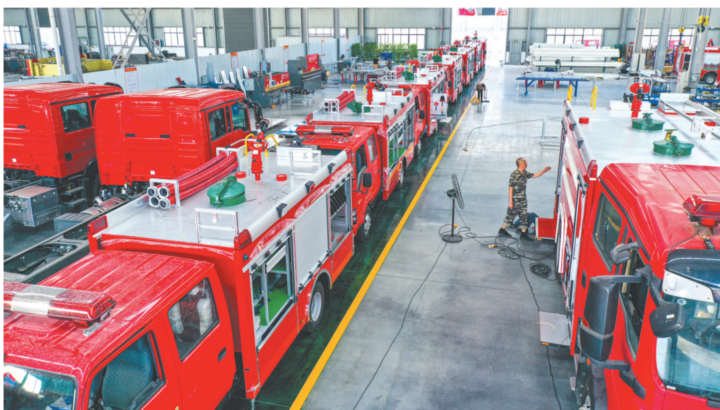
湖北博利特种汽车装备有限公司坚持在提高产品质量和科研投入两个方面着力,10年时间里由一家汽车配件厂成长为隐形冠军和小巨人企业,成为消防生产领域的佼佼者。目前,企业生产订单不断,预计今年销售额将首次突破1亿元。