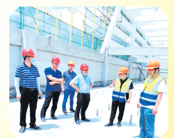
湖北建设监理有限公司组织开展质量安全大排查大整治

随州日报(通讯员郑欢)近日,湖北建设监理有限公司组织全体员工观看了《工程质量安全手册应用与实践》《生命重于泰山》专题片。通过一个个鲜活的质量安全案例,敲响了质量安全警钟,增强了全体人员质量安全的意识。 生产再忙,质量安全不忘。建设监理公司严格落实《安全生产法》《建设工程质量管理条例》,认真落实参建五方主体责任,认真履行质量安全管理职责,杜绝事故发生。同时按照“组织一次专题宣传、组织一次专题培训、组织一次全面检查”等措施,把责任压实落细。认真组织学习、宣传、落实《工程质量安全手册》及《湖北省工程质量安全手册实施细则(试行)》,不断增强法律法规意识和质量安全意识,消除质量安全隐患,筑牢质量安全防线。 该公司定期组织建设单位、施工单位及监理单位进行质量安全综合检查,主要对项目质量管理体系、安全生产责任制落实、施工质量安全教育、质量安全资料收集整理、专项方案编制、原材料见证取样送检制度、工序检查验收程序等进行全方位检查,真正做到问题“零遗留”,整改“零容忍”,处理“零放过”,保障工程高质量建设。