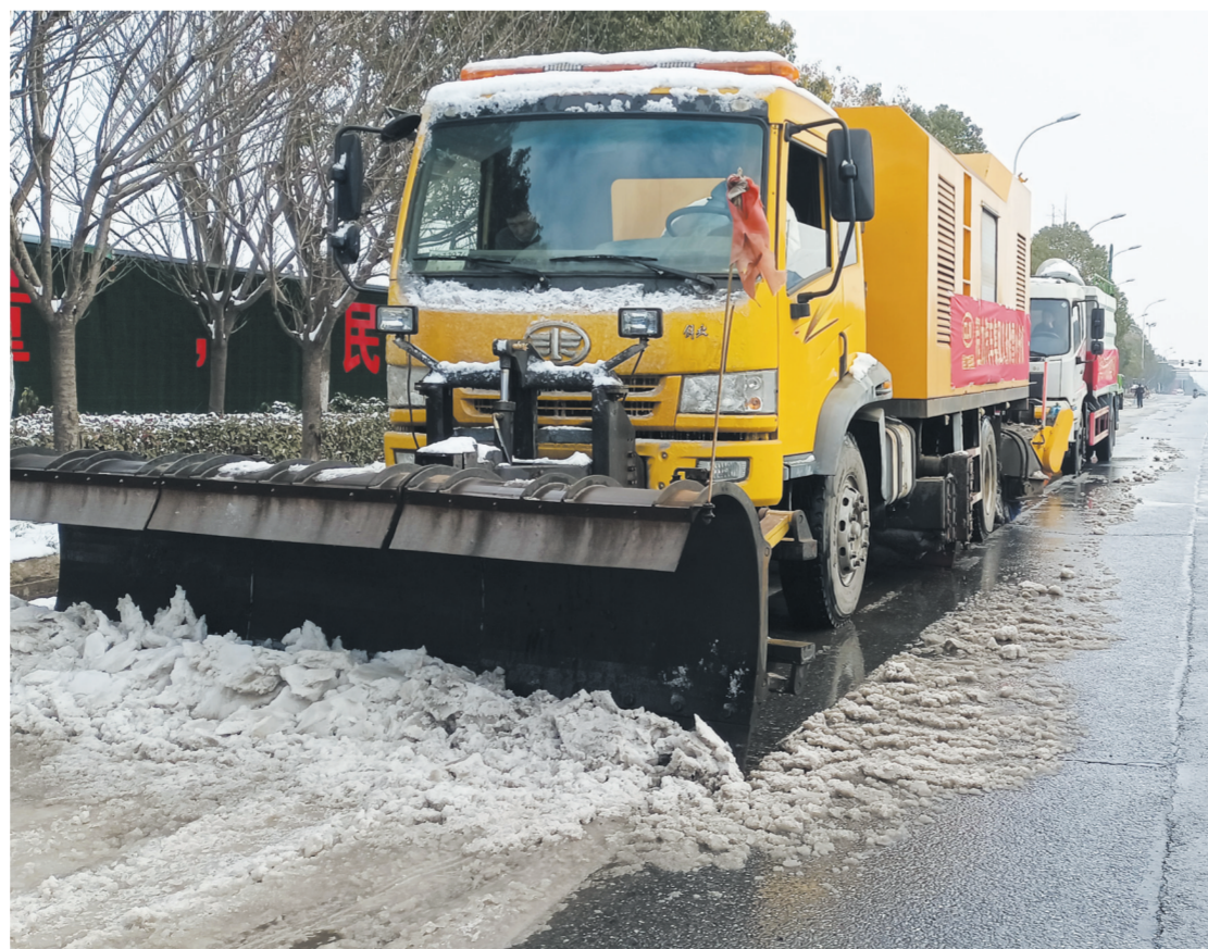
自2月2日晚,程力专汽就组织义务除雪小分队,上街除雪除冰,每天出动除雪车、雪铲车、雪冰车、融雪洒布车、指挥车等5辆应急装备专用汽车,累计出动70余人,全力保障路畅、人安。