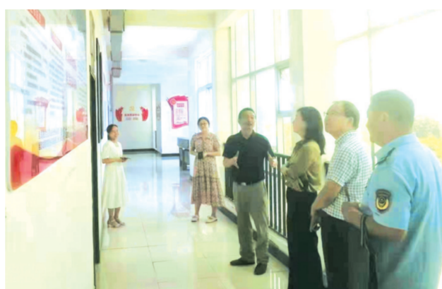
▲ 省市场监管局来随调研“红色消费维权示范站”创建工作