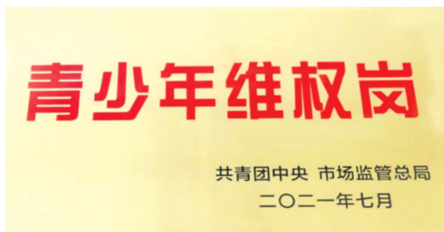
▲ 全国“青少年维权岗”称号