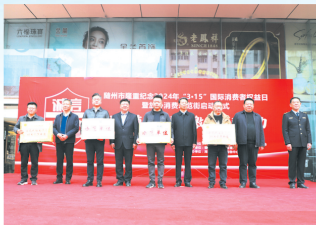
▲ 2024年“3·15”国际消费者权益日纪念活动现场

“红色消费维权示范站”的成立让各类消费纠纷化解在商户、解决在源头,降低消费者投诉维权成本,促进消费环境和营商环境双优化。”随州市市场监管局相关负责人介绍,将逐步在全市推广复制更多共建共治共享的“红色维权站”,切实打通消费维权服务“最后一公里”。