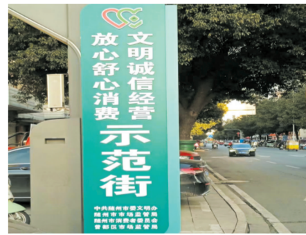
▲ 随州市解放路“文明诚信经营 放心舒心消费”示范一条街

强化示范效应。示范街在本地具有较强的影响力,群众知晓度和社会认同度较高,示范引领提升我市消费环境的安全度、经营者的诚信度和消费者的满意度,使市场秩序更加规范、消费环境更加和谐、诚信体系建设更加完善,进一步提升我市安全放心舒心的消费环境。