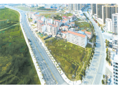
▲ 应山街道民进西路

以“竞进”常态，打造发展环境“强磁场”。坚持把营商环境作为经济发展的“生命线”，出台《企业招工实施办法》，拿出专项资金，与微笑服务公司、社区签订招工奖励协议，全办共为企业推荐1760人，稳定用工552人，有效缓解了企业招工难和群众就业难题。坚持“兑现比承诺更重要，服务比政策更长远”理念，先后兑现百纳电器、德乐电气、广农农业、广睿达、宏合服饰、吉昌五金的招商引资优惠政策；帮助企业解决影响生产经营较为突出问题27个，全面助力毅兴智能公司上市，目前，毅兴智能已完成湖北证监局上市辅导验收和深圳证券交易所IPO问询，正排队上市。