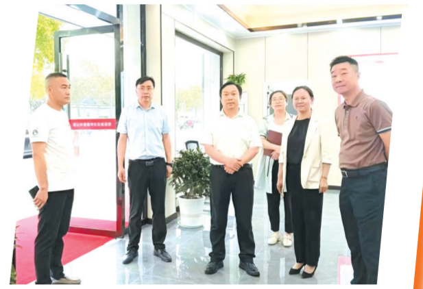
▲ 广水市委书记杨光胜到应山街道调研党建引领基层治理工作

组织年轻干部开展述职比拼，让“拼抢干、精益干、务实干、创造干、干净干”蔚然成风。持续提升治理效能。深入推进美好环境与幸福生活共同缔造，构建纵向到底的基层党组织和横向到边的各类社会组织体系，共成立网格党支部170个，党员中心户2513户。社会资源得以整合、群众需求得以满足、治理成效得以提升。前河社区作为共同缔造示范点，高标准迎接了省委常委、组织部长张文兵，省委常委、统战部长李咏等各级领导调研指导，得到高度认可。