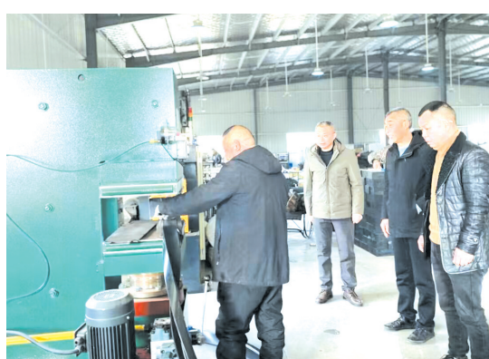
▲ 财政所负责人一行到企业调研生产情况