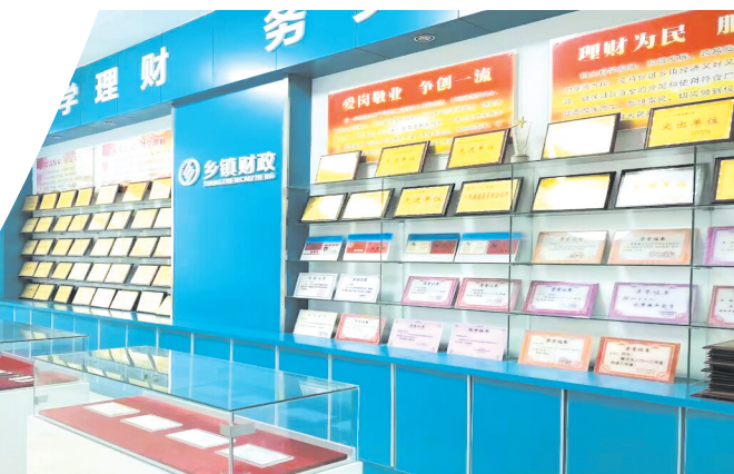
▲ 财政所荣誉陈列室