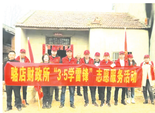
▲ 开展志愿服务活动