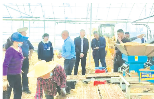
▲ 财政所负责人到双塘村乡村合作公司了解公司发展情况