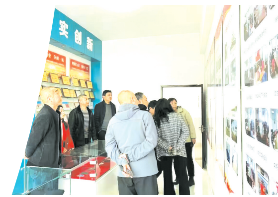
▲ 迎接省级示范财政所创建考评验收