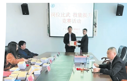
▲ 开展岗位比武活动