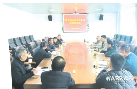
▲ 召开乡村合作公司发展座谈会