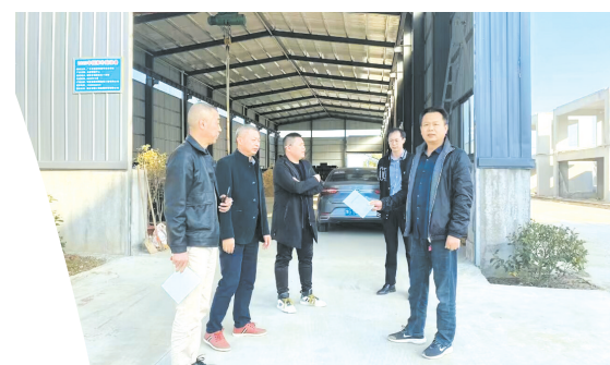
▲ 入企宣传优化营商环境政策