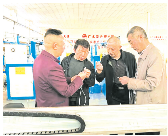
▲ 骆店财政所班子成员深入企业调研