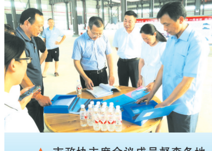
市政协主席会议成员督查各地“一线协商·共同缔造”行动推进情况