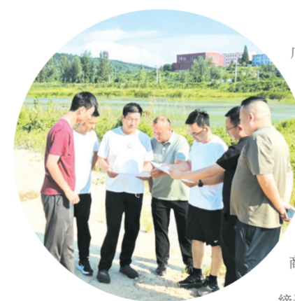
随县殷店镇政协活动小组开展实地调研,共同商议“连心桥”选址及设计方案