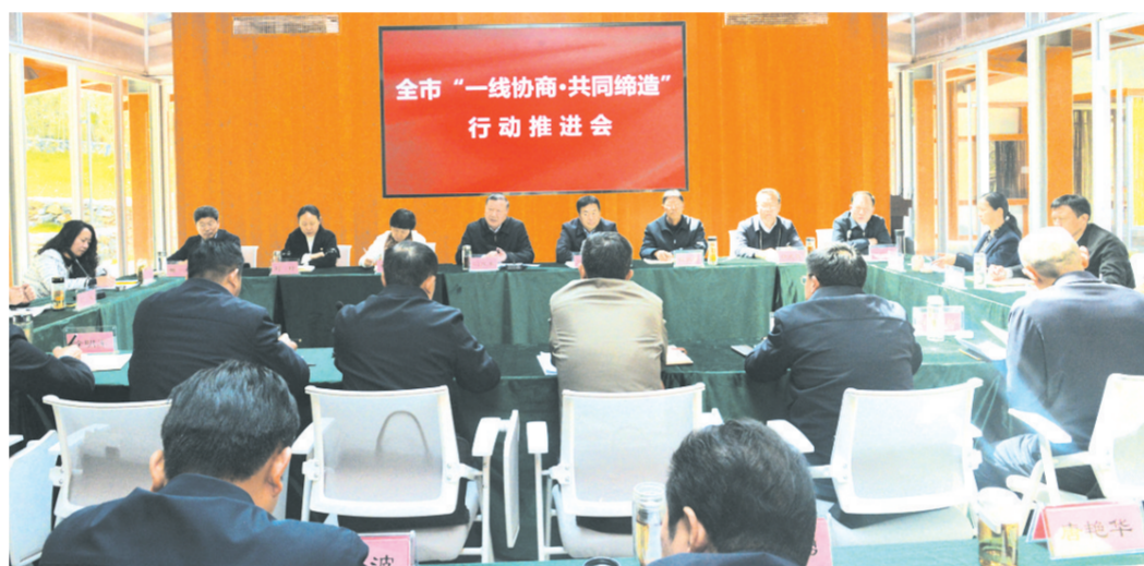
全市“一线协商·共同缔造”行动推进会在曾都区召开