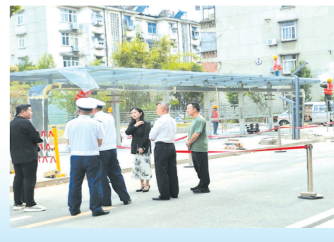
曾都区北郊街道楚凤社区通过“一线协商”推动小区充电桩建设项目落地

民生无小事,枝叶总关情。市政协将持续深化“一线协商·共同缔造”行动,按照“协商于民、协商为民”的理念,再鼓干劲、再加力度,不断推进“一线协商·共同缔造”行动走深走实、见行见效,为加快建设城乡融合发展示范区作出新的更大贡献。