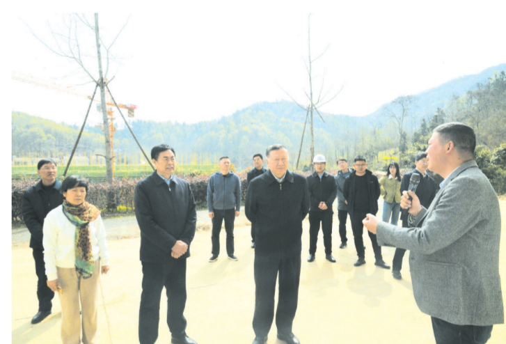
市政协主席冯茂东带队在曾都区洛阳镇开展“一线协商·共同缔造”行动现场调研