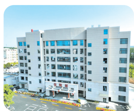
▲ 唐集镇中心卫生院综合大楼建成并投入使用

和美乡村。推动民生福祉更有温度。完善养老服务设施建设，新建江山红康养中心和镇级医养护理中心，满足老年人多元化养老需求。完成镇级殡仪服务中心建设，对镇级殡仪服务中心原有设施进行升级改造，提升殡仪服务水平。