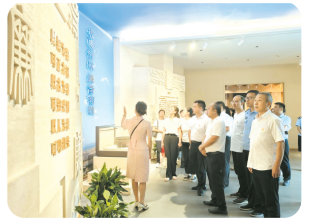
▲ 唐集镇政府机关党支部到随州廉洁文物展馆开展警示教育活动