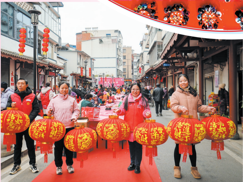
曾都区西城九曲湾百家宴