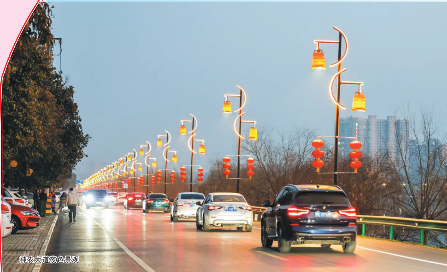
神农大道夜色景观