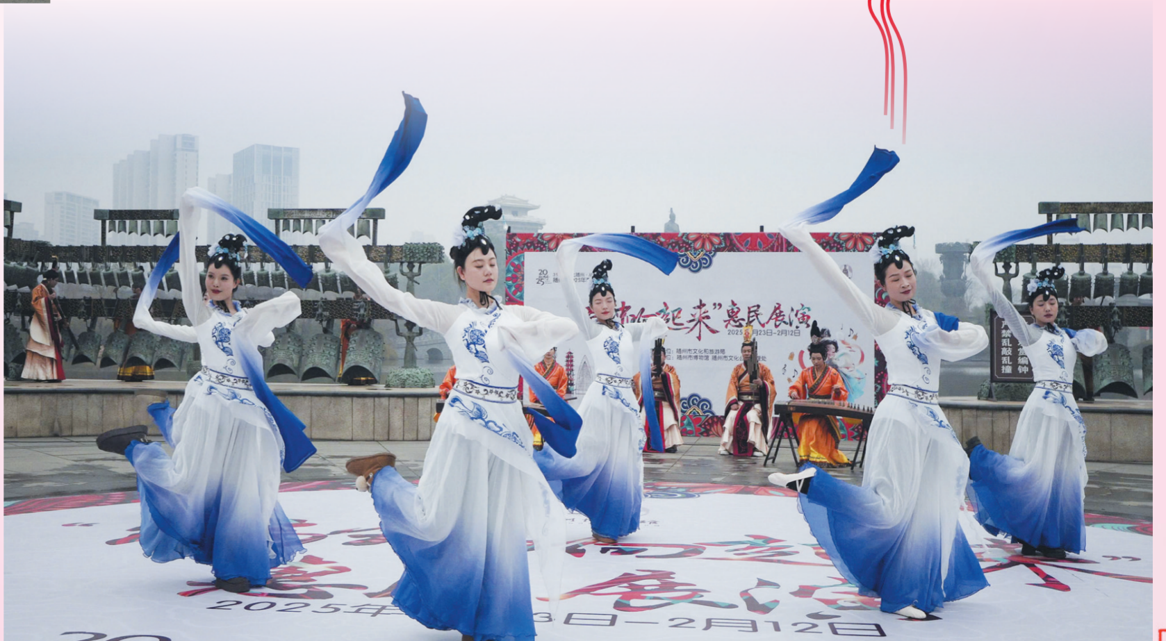
随州文化公园编钟乐舞展演