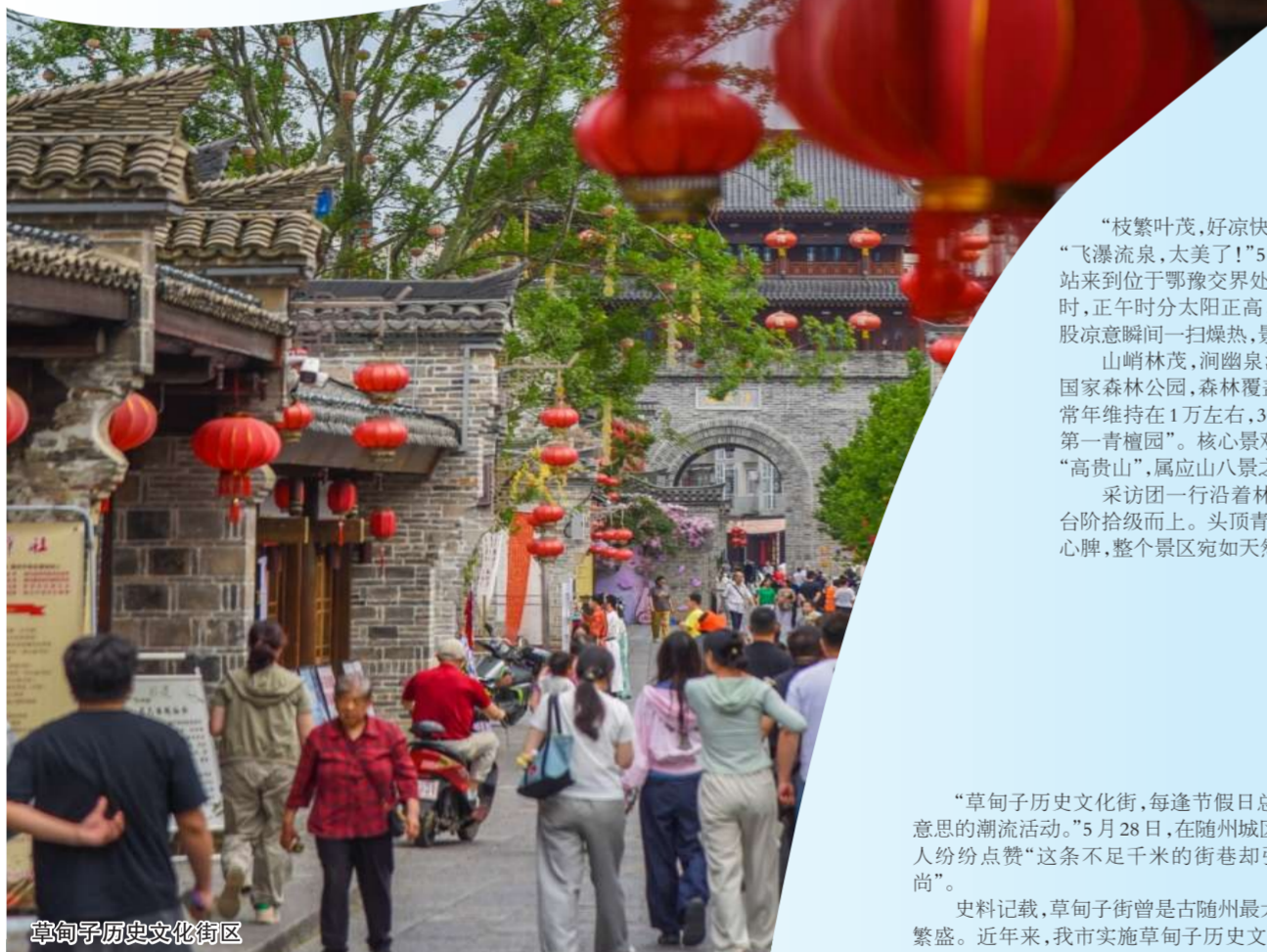
草甸子历史文化街区

依托天然生态环境和交通区位优势,高贵三潭正全力开发溯溪体验、亲子戏水等沉浸式文旅项目,让游客从“短时打卡”变为“深度慢游”,做强生态旅游。