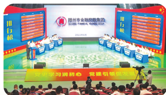
冠名主办随州市“金控杯”党建知识竞赛

践行为民初心。将社会责任融入发展全过程。累计投入50余万元资金用于乡村振兴驻村基础建设、产业发展、困难救助,投入20余万元资金用于下沉社区环境整治、红色物业建设、困难群众慰问。组织党员干部常态化下沉社区开展志愿服务400余人次,用心用情解决群众“急难愁盼”问题。荣誉是过往奋斗的里程碑,更是接续奋进的冲锋号。站在新的起点,市金控集团党委将继续高举党建引领旗帜,持续巩固拓展主题教育成果,聚焦服务实体经济本源,持之以恒正风肃纪,不断推动党建与业务从“物理叠加”向“化学融合”深度转变,以更加昂扬的斗志、更加务实的作风,奋力推动单项工作持续领先、整体工作跨越进阶,为随州加快建设“三地一枢纽”、奋力谱写中国式现代化随州篇章贡献更强劲的金融力量。