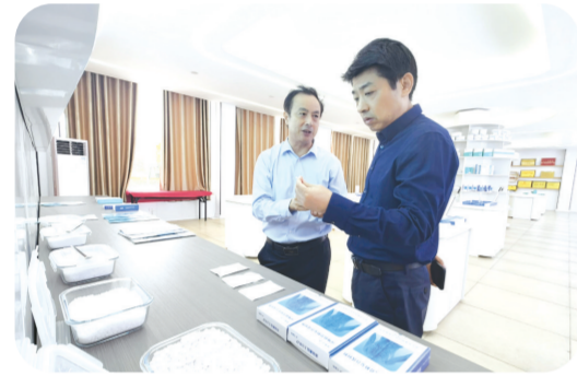
集团领导走访调研科技型企业