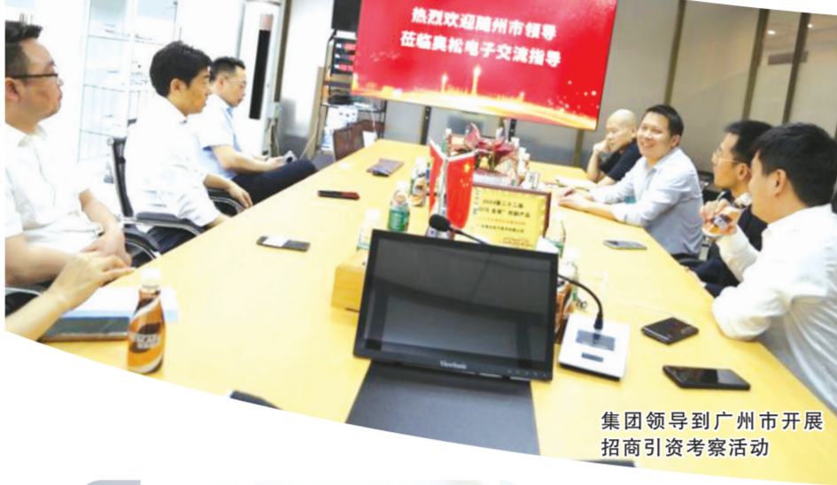
集团领导到广州市开展招商引资考察活动