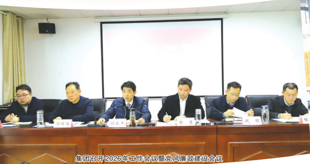
集团召开2026年工作会议暨党风廉政建设会议