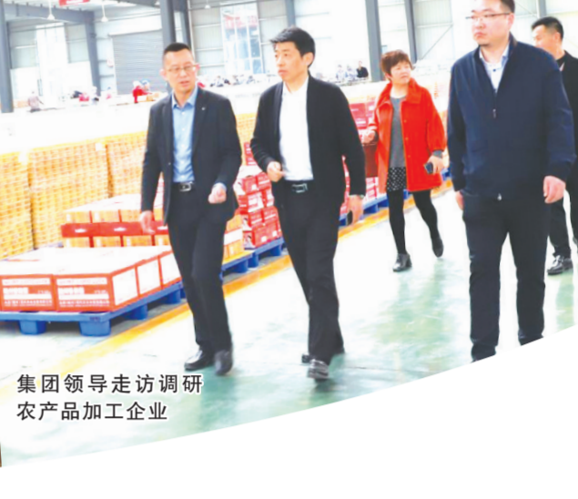
集团领导走访调研农产品加工企业