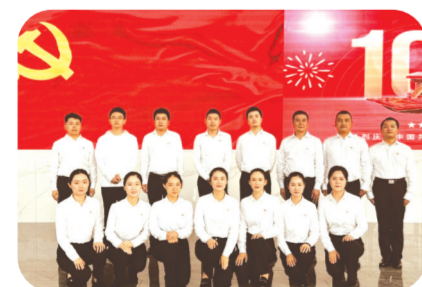
参加随州市“建功支点机关先行”党建示范主题展演

完善治理机制,明晰权责边界。集团坚持党对国有企业的全面领导,全面落实“党建入章”要求,制定《党委前置研究讨论事项清单》《“三重一大”决策制度实施办法》《集团公司与子公司权责事项清单》“三张清单”,厘清权责边界,明确党委在法人治理结构中的法定地位和决策权限。2025年,集团党委研究“三重一大”事项53项,确保党委“把方向、管大局、保落实”的领导作用在公司治理各环节得到充分发挥。