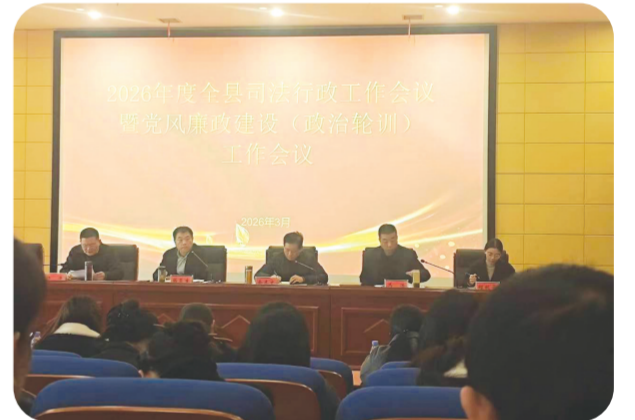
▲ 2026年全县司法行政工作会议

法律服务便民暖心。精准开通未成年人、农民工、军人军属等群体法律援助绿色通道,简化受理程序,压缩办理时限,做到“应援尽援、应援尽援”。2026年以来,受理法律援助案件263件,接待法律咨询1000余人次。公证服务推行“上门服务”“延时服务”“远程公证”,办理公证业务763件,提供公益及上门公证216件,打通法律服务“最后一公里”。聚焦青少年群体,构建“沉浸式研学、定制化普法、专业化维权、个性化矫正”四维一体服务体系,以法治力量护航青少年健康成长。因妇女儿童权益保障工作成效突出,获评“湖北省维护妇女儿童权益先进集体”,并获得“全国维护青少年权益岗”创建推荐。智慧矫正精准监管。坚持底线思维,深化智慧矫正建设,全面推广应用湖北省社区矫正一体化平台,实现对社区矫正对象从矫正衔接接到日常管理,从业务审批到矫正解除全过程的动态监管,筑牢脱管漏管防线。创新构建“技能培训+就业帮扶”模式,联合人社部门开展“香菇种植工”等实用技能培训,采取“理论+实操”教学,助力安置帮教人员掌握一技之长。创新推行“一人一策”精准帮扶机制,推广基层“四零”帮扶经验,联合民政、人社、公安等部门,重点解决刑满释放人员住房、就业、社保、心理疏导等难题,提前介入化解多起起端风险隐患。健全跨区域联动机制,规范外出务工对象委托管理,有效预防和减少刑满释放人员重新违法犯罪。