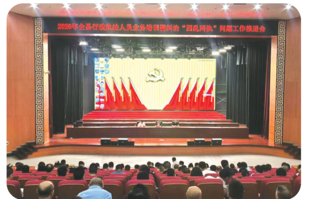
▲ 2026年全县行政执法人员业务培训