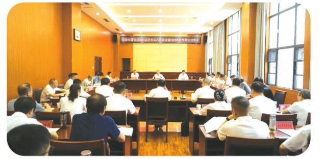
▲ 县委全面依法治县委员会第八次会议