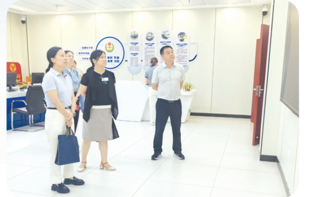
▲ 省委依法治省办调研组到随县调研法治建设工作

“按制度办事、靠实绩进位”的氛围日益浓厚。阵地建设“聚力赋能”。为让党员活动有场所、组织生活有依托,该局对机关党员活动室进行了全面升级改造,建成了集学习教育、会议议事、宣誓展示、谈心谈话等功能于一体的标准化党员活动阵地,打造有温度、有内涵、有实效的党建阵地。规范完成机关党支部书记补选工作,选优配强支部委员会班子,设立八个“党员先锋岗”,组建“红色法律服务团”“法治宣讲志愿服务队”“社区矫正帮扶志愿队”三支特色志愿服务队伍。从硬件升级到软件提质,从组织覆盖到功能提升,该局支部建设实现了从“有形覆盖”向“有效覆盖”的全面跃升,真正把基层党组织建设成为团结群众、攻坚克难的坚强战斗堡垒。